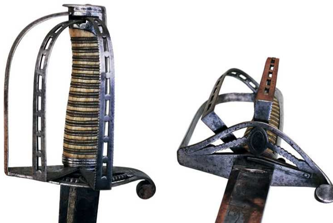
SABLE DE OFICIAL, HACIA 1800. GUARNICIÓN DE ESTRIBO CON GUARDAMANO EXTENSIBLE, EN HIERRO. PUÑO DE MARFIL, GALLONADO Y ALAMBRADO. LA HOJA (725 x 31 mm flecha 35 mm) MARCADA “I S & C”, CON LABRADO ESPACIADO, PROPIO DE LA MANUFACTURA DE SOLINGEN.