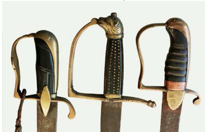
SABLES DE OFICIAL, A DATAR EN EL ÚLTIMO TERCIO DEL SIGLO XVIII. GUARNICIONES DE ESTRIBO, PUÑOS DE ÉBANO EXCEPTO EL DEL CENTRO, EN ASTA. LAS HOJAS DEL MISMO TIPO, (770/775 x 34 mm, flecha 30 mm), LABRADAS CON MOTIVOS ASTRALES Y REFERENCIAS TURCAS, PROPIA DE LA MANUFACTURA DE SOLINGEN.