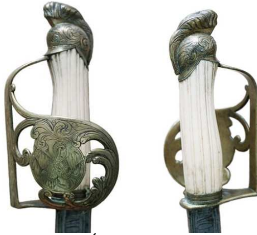
SABLE DE OFICIAL, A DATAR EN EL ÚLTIMO TERCIO DEL SIGLO XVIII. GUARNICIÓN DE ESTRIBO CON MEDIA CAZOLETA, CALADA Y LABRADA CON TROFEO DE ARMAS, PUÑO DE MARFÍL. LA HOJA (772 x 28 mm.) LIGERAMENTE CURVA, INSCRITA “NO ME SAQVES SIN RASON” / “NO ME ENVAINES SIN HONOR”. SE OBSERVA AUSENCIA DEL GALLUELO, ACCIDENTADO.