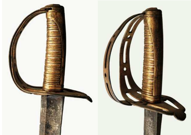
SABLE DE OFICIAL, HACIA 1800. EMPUÑADURA EN LATÓN SOBREDORADO, GUARNICIÓN EN ARO CON GUARDAMANO EXTENSIBLE. LA HOJA (770 x 33 mm flecha 20 mm) LABRADA EN ANVERSO CON ARMAS REALES E INSCRIPCIÓN “VIVA CARLOS III”, AL REVERSO “REY DE LAS ESPAÑAS”.