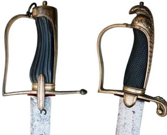
ESPADAS O SABLES RECTOS DE OFICIAL, HACIA 1800. GUARNICIONES DE ESTRIBO, PUÑOS DE ÉBANO. EN EL DE LA IZQUIERDA HOJA DE UNA ESPADA DE MUNICIÓN PARA INFANTERÍA (680 x 30 mm), FECHADA EN 1799. EN EL DE LA DERECHA HOJA DE UNA ESPADA DE MONTAR, ACORTADA (770 x 35 mm), DOBLE FILO EN DOS MESAS.