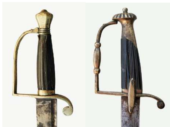
SABLES DE OFICIAL, HACIA 1820. GUARNICIONES DE ESTRIBO. EL DE LA IZQUIERDA CON PUÑO EN ASTA, HOJA (648 x 33 mm. flecha 33 mm) SIN INSCRIPCIONES O MARCA, EN EL DE LA DERECHA EMPUÑADURA IGUAL A LA DEL SABLE FRANCÉS DE OFICIAL DE INFANTERÍA, HACIA 1800. PUÑO DE ÉBANO, HOJA (812 x 31 mm flecha 25 mm.) INSCRITA “POX MY LEY Y POX MY REY” EN ANVERSO Y REVERSO.