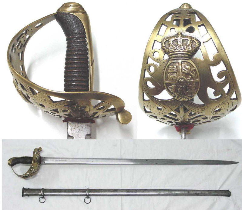
ESPADA DE MONTAR DEL ESCUADRÓN DE GUARDIAS DE S.M. LA REINA, HOJA DE DOBLE FILO EN TRES MESAS INSCRITA “REAL CUERPO DE GUARDIAS DE S.M. LA REINA” / “ARTILLERÍA, FÁBRICA DE TOLEDO 1852”