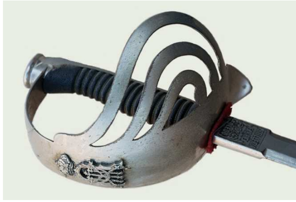
ESPADA DE MONTAR Md. 1875 PARA ESCUADRÓN DE LA ESCOLTA REAL. HOJA (875 x 26 mm) MARCADA "ARTILLERÍA / FÁBRICA / DE / TOLEDO" SIN FECHA (HACIA 1900).