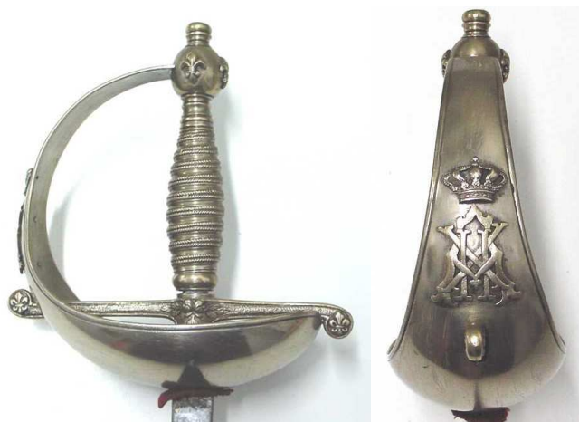
ESPADA DE CEÑIR DE OFICIAL DEL ESCUADRÓN DE LA ESCOLTA REAL, CIFRA "A XII" EN LA GUARNICIÓN, LA HOJA INSCRITA "FABca DE TOLEDO 1874". EN OTRO EJEMPLAR, CON HOJA INSCRITA "FABca DE TOLEDO 1887", CIFRA "A XIII" EN LA GUARNICIÓN (ALFONSO XII FALLECIÓ EN 1885).