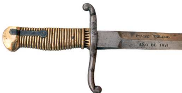
ESPADA-BAYONETA DE LAS COMPAÑÍAS DE INFANTERÍA DE LA GUARDIA DE S.M. EL REY. LA HOJA (696 x 25 mm) INSCRITA "Fca. DE TOLEDO" / "AÑO DE 1871". DOBLE FILO EN DOS MESAS.