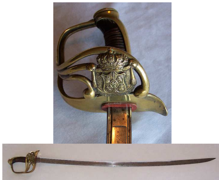
VARIANTE DE OFICIAL, CON ESCUDO, DEL SABLE Md. 1825 PARA CABALLERÍA LIGERA. EL ESCUDO, LAS ARMAS DE ESPAÑA SOBRE MANTO DE ARMIÑO, EN DISEÑO QUE REMEMORA LOS REFERENTES A LA CASA REAL DURANTE LA SEGUNDA MITAD DEL SIGLO XIX. HOJA (895 x 26 mm flecha 25 mm) INSCRITA “ Fabrica Nacional de Toledo, Año de 1844 ” ¿SABLE DE OFICIAL DEL CUERPO DE GUARDIAS DE S.M. LA REINA?.