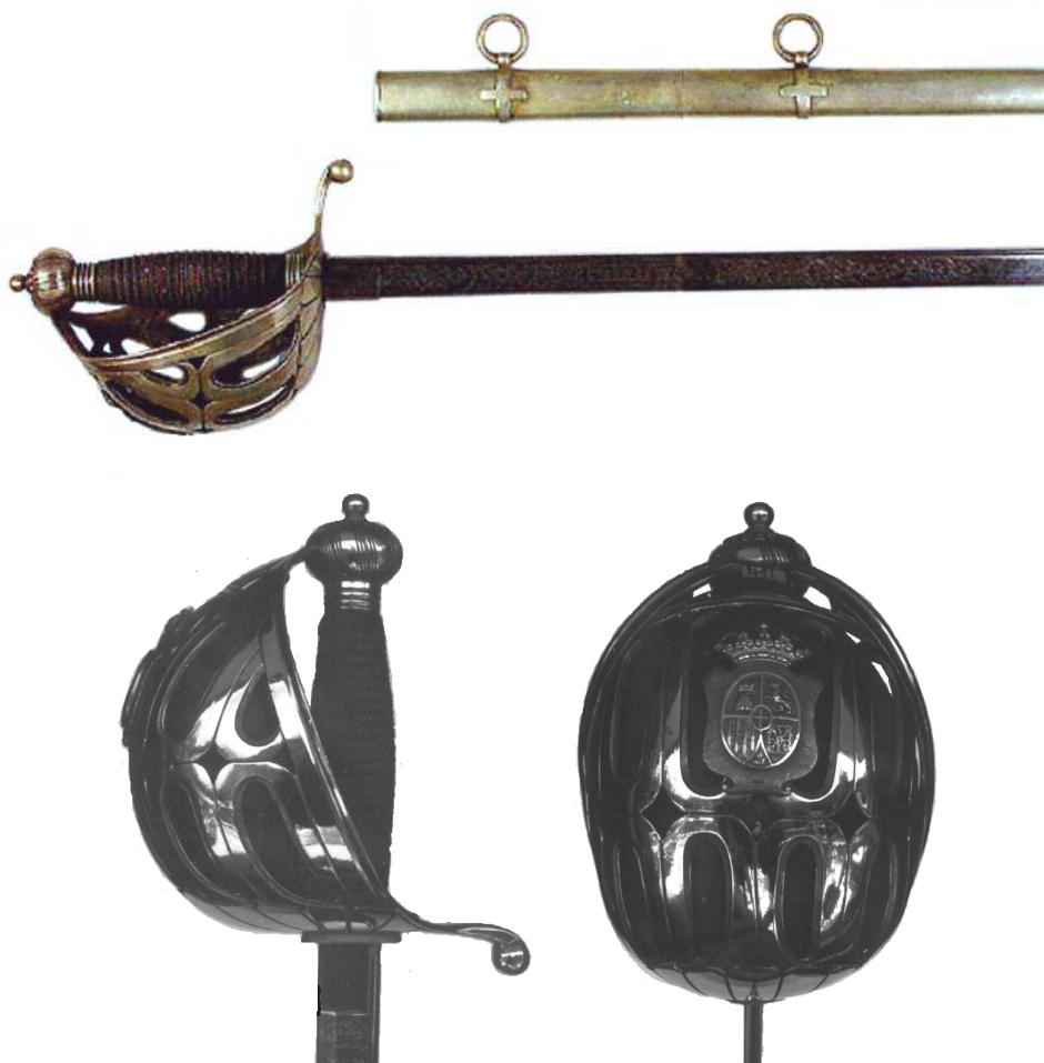
ESPADAS DE MONTAR DE OFICIAL (??) DE LA COMPAÑÍA A CABALLO DE GUARDIAS DE S.M. EL REY. EN EL EJEMPLAR INFERIOR, LA GUARNICIÓN CON FORRO INTERIOR, EN PAÑO ROJO. HOJA (845 x 22,4 mm) INSCRITA "GUARDIAS DEL REY" / "FÁBRICA DE TOLEDO 1871", EN LA GUARNICIÓN, PUNZÓN "J / MARTÍN".