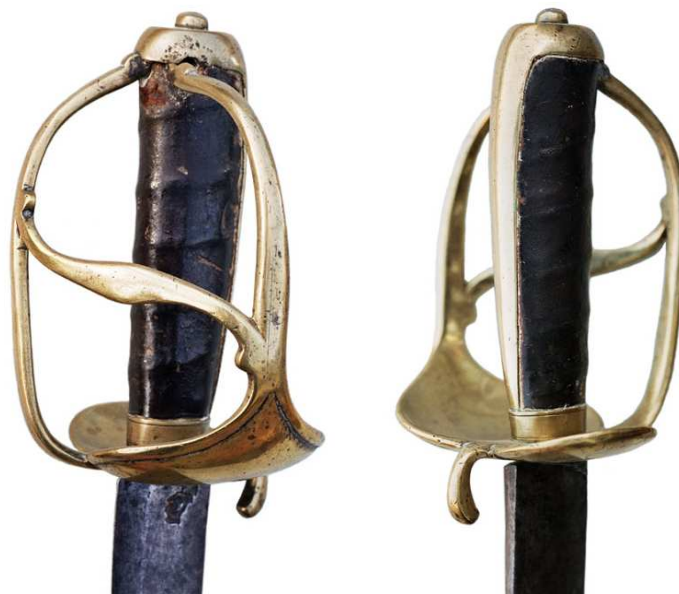
ESPADA DE INFANTERÍA, HACIA 1770. LA HOJA (690 x 34 mm) CON PUNZONES DE DAGUERO Y DE LA CIUDAD DE BARCELONA, FILO EN MESA AL EXTERIOR, LOMO CUADRADO EN EL PRIMER TERCIO, DOBLE FILO EN TRES MESAS EN LOS DOS RESTANTES