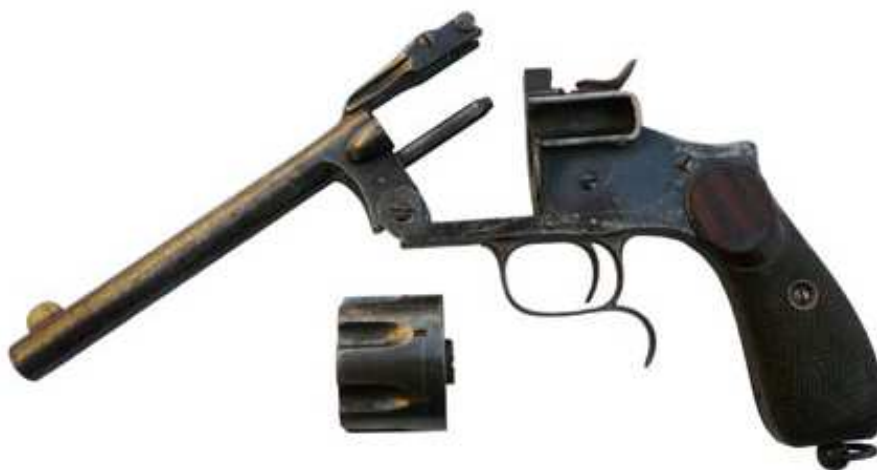
REVOLVER CON SISTEMA DE EXTRACCIÓN GASEOSA IBARRA, SEGUNDO PROYECTO PIÑAL. SIETE RECÁMARAS, CALIBRE 9 mm. CAÑÓN LONGITUD 146 mm.

El segundo proyecto de revólver Piñal se dice producido en la fábrica de Oviedo el año 1882, en número de cincuenta unidades. Basado en el Smith & Wesson Model 3 al igual que el modelo de construcción contratada por Ibarra, pero para cartuchos calibre 9 mm y con tambor dotado con siete recámaras, lo que le permitía alojar la carga convencional de seis cartuchos, dejando vacía la recámara que recibiría los gases del primer disparo.