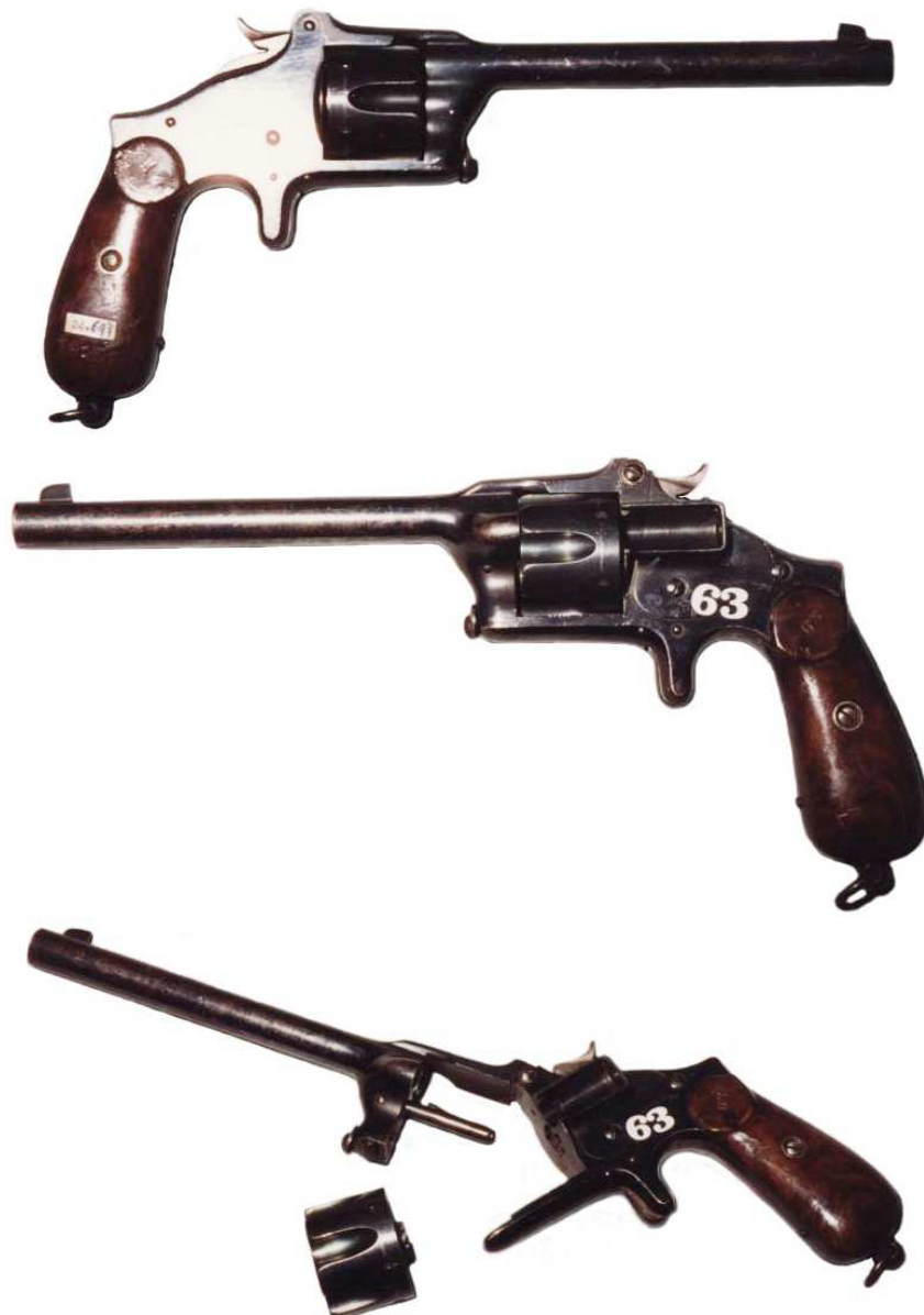
REVOLVER CON SISTEMA DE EXTRACCIÓN GASEOSA IBARRA, PRIMER PROYECTO PIÑAL. SEIS RECÁMARAS, CALIBRE 9 mm. CAÑÓN LONGITUD 162 mm. PIEZA N° 5815 DE LA COLECCIÓN DEL MUSEO DEL EJÉRCITO. En el Catálogo General del Museo de Artillería (Tomo III, 1914) se le atribuye, erróneamente, calibre 11 mm.

En 1890 pasó a la Fábrica de Toledo y en 1891 al Parque de Burgos, siendo condecorado por dos memorias presentadas acerca de la modificación del cartucho reglamentario a utilizar en el armamento de infantería. En 1903 figuraba en comisión en el parque de Guadalajara, para asistencia y participación en las prácticas de aerostación. Este mismo año solicitó el retiro y causó baja en el Cuerpo.