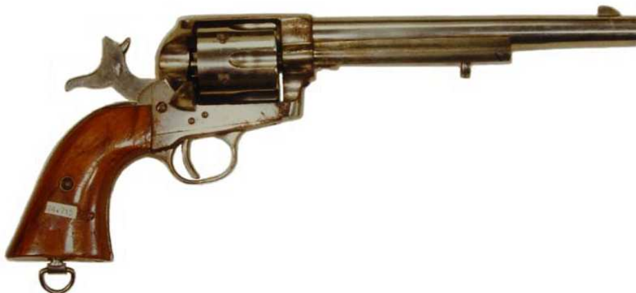
REVOLVER “COLT 1872” EIBARRÉS, ACCIÓN SIMPLE, SEIS TIROS, CAÑÓN LONGITUD 191 mm. INSCRITO “COLT’S SISTEM MANUFACTURERS ANIT. & CHAR. E.G.E. CAL. 45” (Anitua y Charola, Eibar, Guipúzcoa, España). PIEZA N° 24715, EN LA COLECCIÓN DEL MUSEO DEL EJÉRCITO,