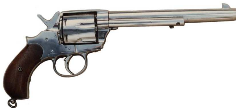
REVOLVER “COLT 1878” EIBARRÉS, DOBLE ACCIÓN, SEIS TIROS, CALIBRE 44, CAÑÓN LONGITUD 191 mm. CARENTE DE INSCRIPCIONES. MANUFACTURA ANÓNIMA.