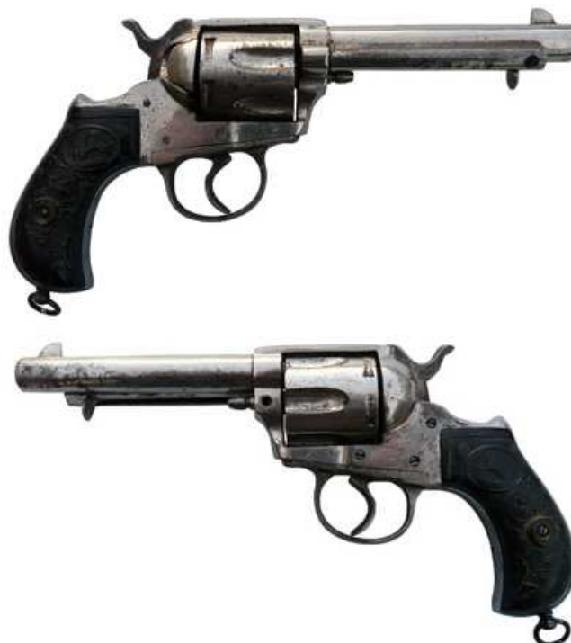
REVOLVER “COLT 1877 LIGHTNING” EIBARRÉS, DOBLE ACCIÓN, SEIS TIROS, CALIBRE 38, CAÑÓN LONGITUD 114 mm. INSCRITO “COLTS SISTEME – REVOLVER EUSKALDUNA T.U. y C a ” (Tomás Urizar y C a )