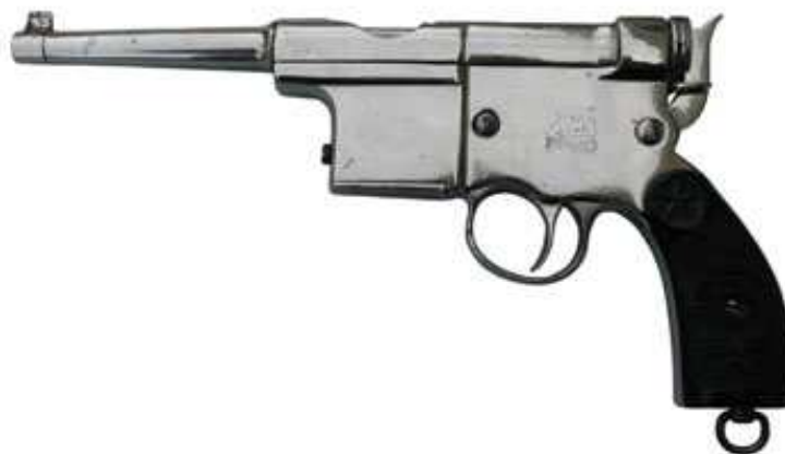
PISTOLA “CHAROLA Y ANITUA”, 2ª SERIE, CAÑÓN INSCRITO “I. CHAROLA – EIBAR CAL. 5 m/m”, CON EL LOGO DEL CARTUCHO ALADO, CON INICIALES “Ch y A”

En las pistolas de la 3ª serie, unas 800 unidades 4 , la longitud del cañón es de 85 mm. figurando inscrita la leyenda “THE BEST SHOOTING PISTOL”. En ellas se reduce la cola o galluelo del martillo percutor. A la 4ª serie corresponden las 400 unidades 5 que restan para totalizar las 3.000 que Conti calcula producidas. En ellas no figuran más marcas que las de prueba de Lieja, señalando fueron fabricadas o montadas en Bélgica, por cuenta de Ignacio Charola.