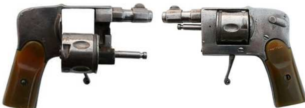
REVOLVER PATENTADO POR IGNACIO CHAROLA EN 1907, CINCO TIROS, CAÑÓN LONGITUD 42 mm. INSCRITO “CAL 6,35”, CON LOGO IMPRECISO EN EL ARMAZÓN (no he localizado el que I. Charola pudo registrar)

Como la mayoría de las eibarresas de la época, las pistolas “Charola y Anitua” no fueron construidas por entero en el taller de la calle Estación, se afirma que la fábrica de “Garate, Anitua y C a .” tuvo papel importante en su manufactura, así como que su venta conoció en Rusia un éxito superior al alcanzado en otros países.