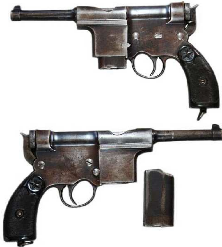
PISTOLA “CHAROLA Y ANITUA” CALIBRE 7 mm, CON CARGADOR, (Fotos H. Meruelo)

Los cartuchos se vendían en cajas de 30, conteniendo cinco peines de seis cartuchos. Para la comercialización del modelo en Cal. 7 mm., Ignacio Charola publicó un folleto de instrucciones, en que se informa de que los cartuchos, producidos por la firma austriaca “Keller & Cie.”, podían adquirirse a la “Unión Española de Explosivos”, que contaba con depósito de los mismos.