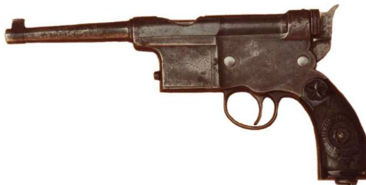
PISTOLA “CHAROLA Y ANITUA”, 2ª SERIE, CAÑÓN INSCRITO “PISTOLA AUTOMATICA PATENTE CHAROLA Y ANITUA – EIBAR”, MARCA CORRESPONDIENTE A LA 1ª SERIE