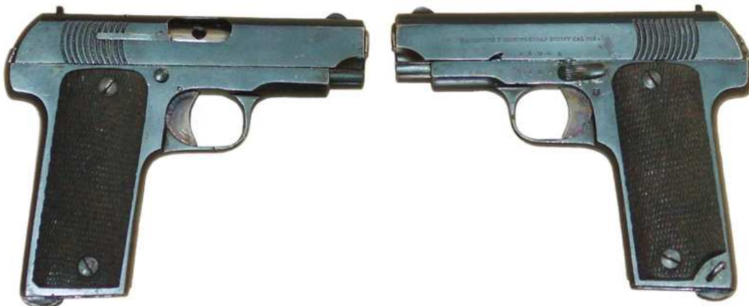
PISTOLA “RUBY”, NUEVE TIROS, Cal. 7,65 mm. CAÑÓN LONGITUD 88 mm. MARCADA “GABILONDOS Y URRESTI . EIBAR – RUBY CAL. 7,65”

El cierre de mercados y la moratoria de créditos internacionales, al iniciarse la Gran Guerra, supusieron un drama para los industriales armeros eibarreses. El Consistorio hubo de tomar medidas para atender a los parados: inició la construcción de la carretera Eibar – Aguinaga, en que muchos mecánicos tiraron de pico y pala, y organizó una “cocina popular”, que suministraba alimentos a precio de coste.