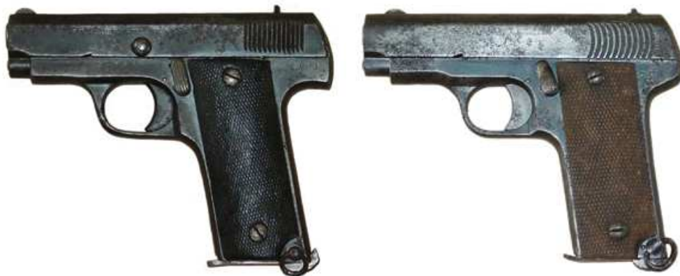
PISTOLAS TIPO “RUBY”, NUEVE TIROS. Izda, MARCADA “PISTOLA AUTOMATICA CALIBRE 7,65” / “GARATE ANITUA ... EIBAR (ESPAÑA)”. Dcha. MARCADA “CAL 7,65 PISTOLET AUTOMATIQUE ‘DESTROYER’ / I. GAZTAÑAGA – EIBAR”.

No es el caso de las pistolas “STAR” Md. 1914, Cal. 7,65 mm. también adquiridas por el Ejército francés en 1915, ya que estas resultaban de la aplicación de unas patentes propiedad de Bonifacio Echeverría, al igual que la marca “STAR”. Fueron adquiridas en número de 24.700 unidades, ínfimo en comparación con las “tipo Ruby”, de las que se calcula se suministraron en cantidad superior a las 900.000 unidades, adquiridas no sólo por Francia, también por Rumania, Grecia e Italia.