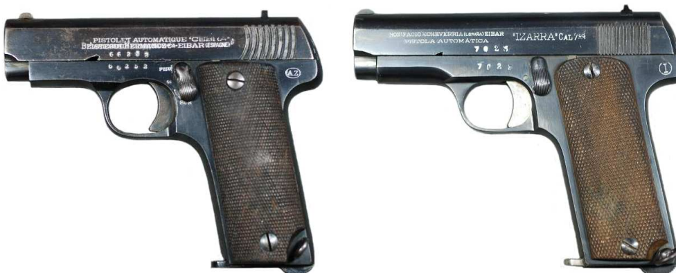
PISTOLAS TIPO “RUBY”, NUEVE TIROS, Izda. EJEMPLAR MARCADO “PISTOLET AUTOMATIQUE CEBRA / BEISTEGUI HERMANOS C a - ESPAÑA”. LOGO “AZ” (Arizmendi, Zulaica y C a ). Dcha. EJEMPLAR MARCADO “BONIFACIO ECHEVERRIA (ESPAÑA) EIBAR / PISTOLA AUTOMATICA / ‘IZARRA’ CAL 7,65”.