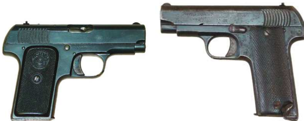
PISTOLAS “VICTORIA”, DE “ESPERANZA Y UNCETA”. IZDA, SIETE TIROS, MARCADA “7,65 1911 MODEL AUTOMATIC PISTOL / “VICTORIA” PATENT”, CON LOGO “VICTORIA EU”. DCHA. TIPO “RUBY”, NUEVE TIROS, MARCADA “7,65 1911 MODEL AUTOMATIC PISTOL / “VICTORIA” PATENT”, CON LOGO “EU”.

En 1914 la firma modificó su razón social por la de “Gabilondos y Urresti”, señalando la incorporación de otro socio apellidado Gabilondo. Fue este año que registró la marca “RUBY”, utilizada en unas pistolas que no diferían de las “VICTORIA” calibre 7,65 mm., de siete tiros, más que por la mayor longitud de su empuñadura, para alojar un cargador con capacidad para nueve cartuchos. En la fabricación de las “VICTORIA”, “Esperanza y Unceta” utilizaban las patentes de Pedro Careaga y tal vez alguna de las propias, obtenidas los años 1911 y 1912. A nombre de “Gabilondo y Urresti” o “Gabilondos y Urresti”, no aparece patente alguna, la marca “RUBY” era lo único de esta pistola, de su exclusiva propiedad.