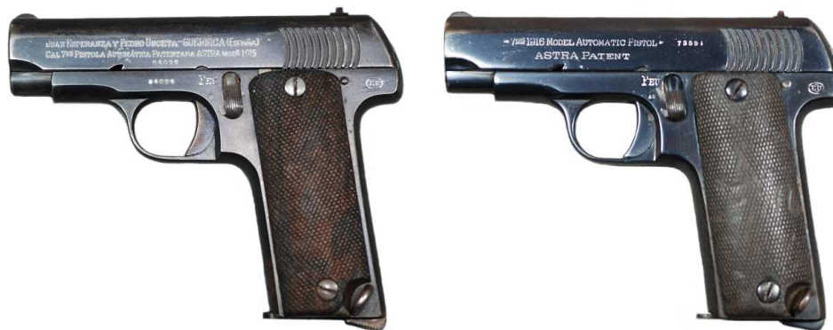
PISTOLAS TIPO “RUBY”, NUEVE TIROS. Izda. EJEMPLAR MARCADO “JUAN ESPERANZA Y PEDRO UNCETA – GUERNICA (ESPAÑA) / CAL 7,65 PISTOLA AUTOMATICA PATENTADA ‘ASTRA’ MOD. 1915”. Dcha. EJEMPLAR MARCADO “7,65 1916 MODEL AUTOMATIC PISTOL / ASTRA PATENT”.

Lo cierto es que no todas las pistolas con la marca “RUBY” tienen como fabricante a “Gabilondos y Urresti” y fueron muchos los que las comercializaron con marcas registradas en estas fechas, como “ASTRA” (“Esperanza y Unceta”, 1914), “ALKAR” y “PANAMA”(“Alkartasuna S.A.”, 1914 y 1915), “EXPRESS” (“Garate, Anitua y C a . 1917), “IZARRA” (Bonifacio Echeverría, 1917), “ERRASTI” (Antonio Errasti), “M. ZULAICA” (Marcelo Zulaica) etc. De aquí que, más que referirse a las pistolas “Ruby”, deba considerarse la existencia de unas pistolas “tipo Ruby”, no todas con la marca “RUBY”.