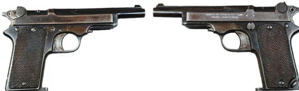
PISTOLA “STAR”, MODELO 1914, Cal. 7,65 mm. OCHO TIROS. CAÑÓN LONGITUD 130 mm. MARCADA “AUTOMATIC PISTOL “STAR” PATENT” Y “STAR CAL 7,65”

No es el caso de las pistolas “STAR” Md. 1914, Cal. 7,65 mm. también adquiridas por el Ejército francés en 1915, ya que estas resultaban de la aplicación de unas patentes propiedad de Bonifacio Echeverría, al igual que la marca “STAR”. Fueron adquiridas en número de 24.700 unidades, ínfimo en comparación con las “tipo Ruby”, de las que se calcula se suministraron en cantidad superior a las 900.000 unidades, adquiridas no sólo por Francia, también por Rumania, Grecia e Italia.