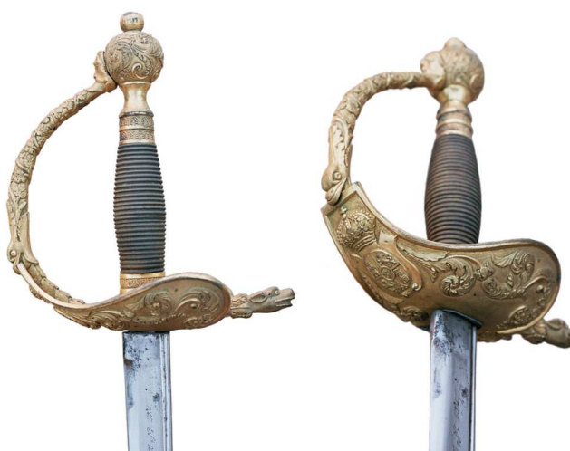
ESPADA DE OFICIAL GENERAL, Md. 1870. EMPUÑADURA EN LATÓN, LABRADA Y SOBREDORADA, GUARNICIÓN A CONSIDERAR EVOLUCIÓN DE LA DE COQUILLA, CON ARMAS DE ESPAÑA. LA HOJA ANTIGUA (771 x 23 mm) INSCRITA EN ANVERSO “Fabrica Nl. de Toledo, Año de 1845”. FILO EN MESA AL EXTERIOR, LOMO REDONDO CON CANAL CONTIGUO EN LOS DOS PRIMEROS TERCIOS, DOBLE FILO EN EL ÚLTIMO.