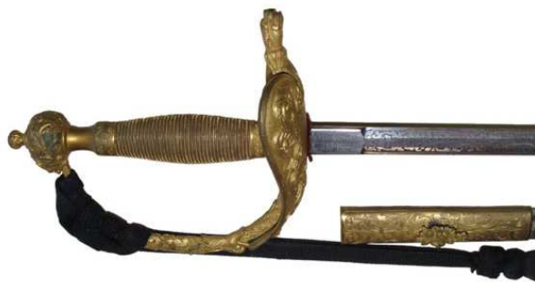
ESPADA DE CEÑIR DE OFICIAL GENERAL, Md. 1870. EMPUÑADURA EN LATÓN, LABRADA Y SOBREDORADA, GUARNICIÓN A CONSIDERAR EVOLUCIÓN DE LA DE COQUILLA, CON ARMAS DE ESPAÑA. HOJA (798 x 15 mm) INSCRITA EN LA BIGOTERA “FABa. DE TOLEDO – 1893”, CON DOBLE FILO EN TRES MESAS Y LABRADA.