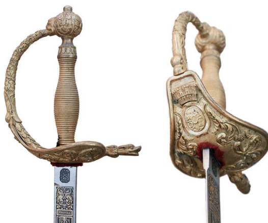
ESPADA DE OFICIAL GENERAL, Md. 1870. EMPUÑADURA EN LATÓN, LABRADA Y SOBREDORADA, GUARNICIÓN A CONSIDERAR EVOLUCIÓN DE LA DE COQUILLA, CON ARMAS DE ESPAÑA MODIFICADAS SEGÚN O.C. DE 27.6.1931 (ESCUSÓN NEUTRO Y CORONA MURAL). HOJA (797 x 21 mm) LABRADA, CON MARCA N° 2 DE LA FABRICA DE TOLEDO (1906) CON CORONA MURAL (1931). FILO EN MESA IMPERCEPTIBLE AL EXTERIOR, LOMO REDONDO EN LA PRIMERA MITAD, DOBLE FILO EL RESTO.