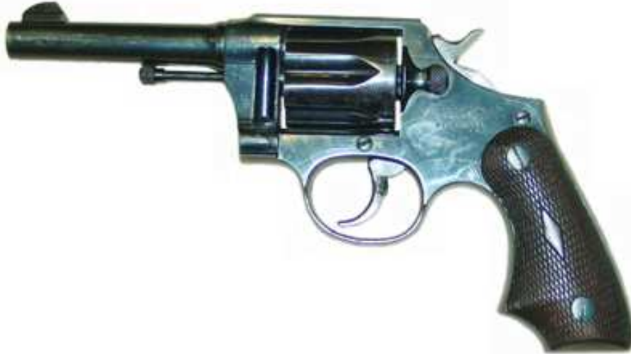
REVOLVER “ATCSA”, Cal. 38, SEIS TIROS, CAÑÓN 4”. NÚMERO 85, MARCADO “ATCSA / PAT. 130396” / “MADE IN SPAIN”

Accesorios de Tiro y Caza S.A.”, que hacia 1930 adquirió a “Eduardo Schilling y C a ” los talleres que tenía en el barrio de Pueblo Nuevo. La vida de esta sociedad fue muy corta, según se afirma, debido a su fracaso en el intento de interesar, a la Generalitat de Catalunya , en la adquisición de sus revólveres, como equipo de Fuerzas de Seguridad. Su desaparición fue anterior al inicio de la Guerra Civil.