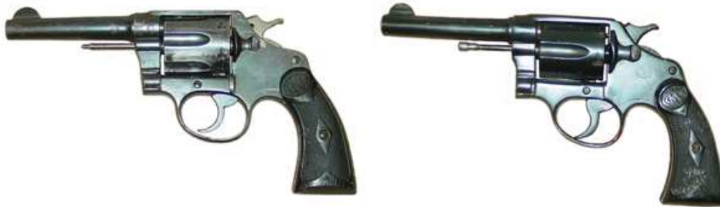
“OSCILANTES” Cal. 38 LARGO, DE LA FIRMA “GARATE, ANITUA Y C a ”. EL DE LA Izda, CON LA MARCA “DETECTIVE”, EL DE LA Dcha, CON LA MARCA “MUXI”

No obstante, abundan los “oscilantes” eibarreses que incluyen logos e inscripciones que constituyen evidente usurpación, de los registrados en España por la “Colt’s Patent” o por la “Smith & Wesson”, sin tener noticia de que ello originara, para quienes incidieran en esta ilegalidad, situación similar a la habida en 1912, entre la “F.N.” y los fabricantes eibarreses de “browning’s”.