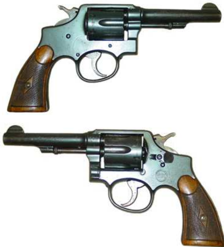
REVOLVER “OSCILANTE”, SEIS TIROS, CALIBRE 38 LARGO, CAÑÓN 4 ½”, MARCA “IMPERIAL”, PRUEBA “H” (1935)

Si en los revólveres eibarreses “Smith”, “Merwin” y “Colt’s”, el apelativo se debía a su “parecido” con los respectivamente presentados por las firmas “Smith & Wesson”, “Merwin, Hulbert & Co.” y “Colt’s Patent Firearms Manufacturing Co.”, en los “oscilantes” era una característica lo que daba origen al apelativo: la “oscilación” del cilindro o tambor en el proceso de carga, o recarga previo desalajo de las vainas mediante el accionamiento manual de su extractor de estrella, característica que tenían en común, entre otros, los modelos presentados por la “Colt’s Patent” y por la “Smith & Wesson”, a partir del Colt Md. 1889 Navy y el Smith & Wesson Military & Police.