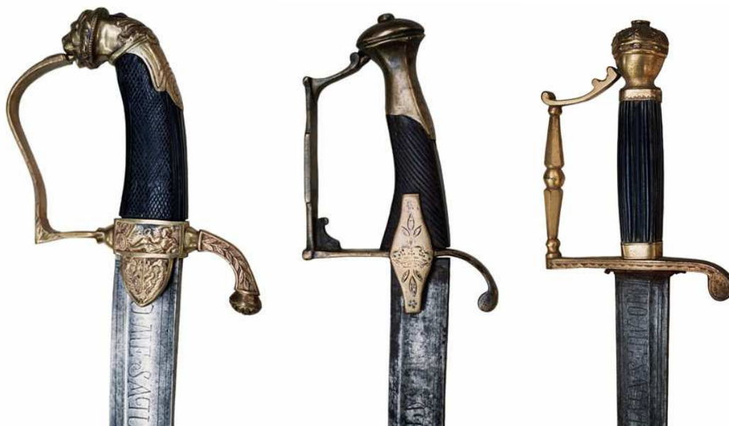
SABLES “DE OFICIAL DE CABALLERÍA”, HACIA 1820. EN LOS TRES EJEMPLARES, GUARNICIÓN DE ESTRIBO EN LATÓN Y HOJAS INSCRITAS CON EL LEMA “NO ME SAQUES SIN RAZÓN” / “NO ME ENVAINES SIN HONOR”.