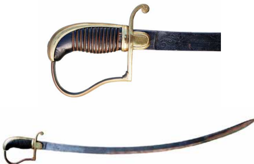
SABLE DE OFICIAL, HACIA 1830. GUARNICIÓN DE ESTRIBO EN LATÓN, CON ESCUDETOS, EL PUÑO EN ASTA, GALLONADO Y ALAMBRADO EN COBRE. LA HOJA (750 x 27 mm flecha 53 mm) INSCRITA “Fª de Ybarzabal” / “En Eybar”. LOMOS REDONDOS, AL EXTERIOR EN EL PRIMER TERCIO, FILO EN MESA EN LOS DOS RESTANTES. AL INTERIOR HASTA LA PALA, DOBLE FILO EN ÉSTA. LAS CARACTERÍSTICAS DE LA HOJA HACEN DE ESTE EJEMPLAR UN PRECEDENTE DE LOS QUE POSTERIORMENTE SE DEFINIERON COMO “SABLES DE TIRANTES”