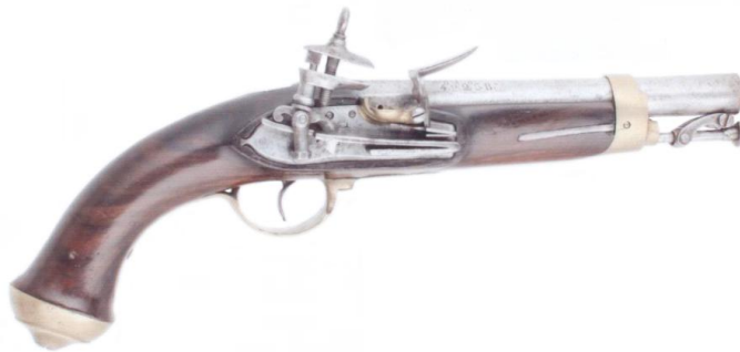
Pistola para Oficiales Menores. Cañón fechado 1824, calibre “de á 17” (18 mm), longitud 200 mm, con “Armas Reales”, inscrito “ RL. Cuerpo de Guards. de la Persona del Rey ”