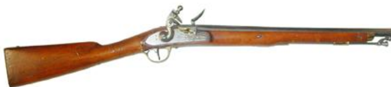
Tercerola para Tiradores. Cañón “calibre de á 17” (18 mm), longitud 503 mm, con “Armas Reales”, inscrito “ RI. Cuerpo de Guards. de la Persona del Rey ”