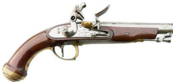
Pistola para Tiradores. Cañón fechado 1832, calibre “de á 17” (18 mm), longitud 175 mm, con “Armas Reales”, inscrito “ RI. Cuerpo de Guards. de la Persona del Rey ”

El modelo de carabina para Guardias, monta llave de miquelete sólo diferenciada por su mayor tamaño, de la de las pistolas para Guardias y Oficial Menor. La tercerola monta una llave “a la francesa”, con cadeneta, sólo diferenciada de la de pistola por su tamaño.