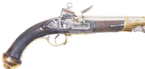
Pistola para Oficiales Mayores. Cañón sin fecha, calibre “de á 17” (18 mm), longitud 178 mm, con “Armas Reales”, inscrito “ RL. Cuerpo de Guards. de la Persona del Rey ”. En mi opinión se debe incluirse entre los ejemplares de producción comercial, pero lo hago figurar aquí por figurar inscrita en su cañón la reseña del Cuerpo.