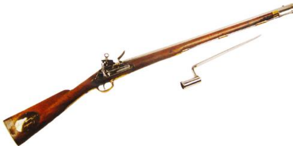
Carabina con bayoneta para Guardias. Cañón “calibre de á 17” (18 mm), longitud 710 mm, con “Armas Reales”, inscrito “RL CUERPO DE GUARDIAS DE LA PERSONA DEL REY”