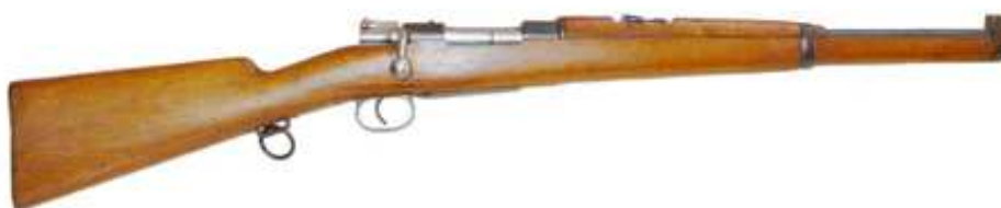
Carabina Mauser, modelo 1895. Pieza Nº 1971-177 en la Colección del M.M.M.

En la reseña de los modelos a equipar al Escuadrón de la Escolta Real, los reglamentos de Caballería de los años 1910 y 1923 son igualmente parcos. Para Jefes y Oficiales estipulan: " Revolver o pistola: La reglamentaria ", y para tropa: " Carabina: Mauser reglamentaria ". En 1910, la pistola reglamentaria era la Bergmann modelo 1908, a la que se sumó en 1914, con igual carácter, la pistola Campo-Giro modelo 1913 y en 1916 la pistola Campo-Giro modelo 1913-16. En 1923 lo era la " pistola para cartuchos de 9 mm. modelo 1921 ", (ASTRA 400). La carabina Mauser reglamentaria era la adoptada por el Ejército en R. O. de 7 de mayo de 1906, como " carabina Mauser Español, modelo 1895 ".