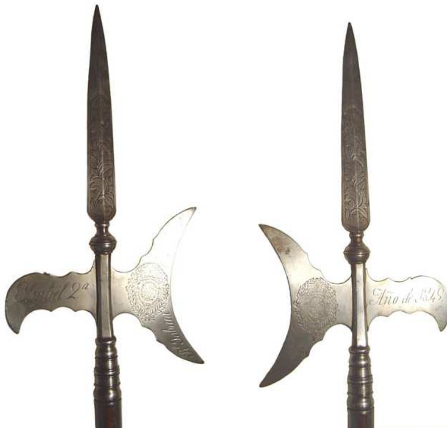
Alabarda del Real Cuerpo de Guardias Alabarderos. La hoja (265 x 34 mm) y la veleta (240 x 195 mm), esta última labrada a ambos lados con las Armas de la Casa Real, inscrita a un lado “ RI. Fabrica de Toledo ” e “ Isabel 2ª ” y al otro “ Año de 1849 ”. Colección E. Gorostiza.

A este Real Cuerpo ya me referí en las entregas 34 y 36. En 1788 la Compañía de Reales Guardias Alabarderos se componía de 1 Capitán, 1 Teniente, 1 Segundo Teniente, 1 Ayudante, 1 Primer Sargento, 1 Segundo Sargento, 1 Capellán, 1 Cirujano, 4 Cabos de escuadra, 4 Segundos Cabos, 128 Alabarderos, 3 Tambores, 1 Pífono y 6 Músicos. Eran Oficiales Mayores desde el Capitán hasta el Ayudante, con graduación en el Ejército desde Mariscal de Campo hasta Comandante, y Oficiales Menores los Sargentos y Cabos, con graduación en el Ejército desde Capitán a Subteniente, los Alabarderos se reclutaban entre los Sargentos veteranos del Ejército, equipándose con alabarda y espada. Un ejemplar de la alabarda inscrita “CARLOS III” y “AÑO DE 1789”, figura en el Catálogo del Museo de Artillería (1911), pieza Nº 1600 de la Colección.