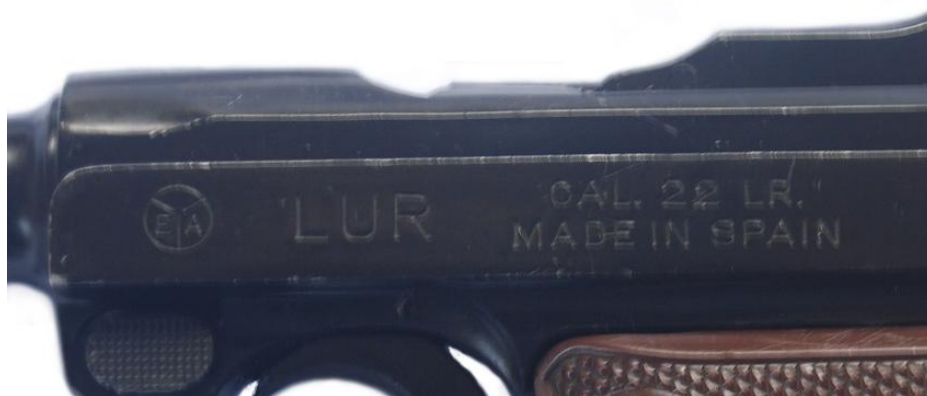
Marcado comercial en la pistola “LUR-PANZER”

en cada cacha la palabra “PANZER” en el interior de un diamante, mientras que los dos ejemplares de mi propiedad, las cachas originales han sido reemplazadas por otras de plástico tomadas de la “ERMA” LA-22, en un ejemplar, de color marrón-rojizo, imitando madera, y en el otro, en negro. El número de serie y las marcas de prueba figuran en el lado derecho, y, curiosamente, los dos ejemplares carecen de punto de mira; extraído en uno de ellos y mutilado en el otro.