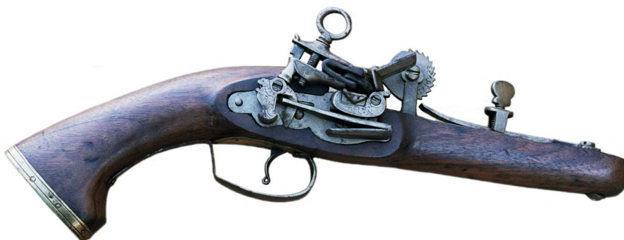
PIEZA N° 1963-203: Probador de pólvora, manufactura catalana, finales del XVIII. Llave de miquelete inscrita "VANET" sobre la tapa de la cazoleta, rueda dentada con graduación numerada del 1 al 9. Longitud total de la pieza: 34 centímetros.