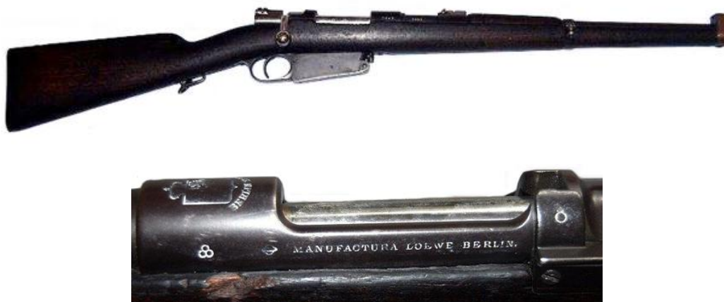
Carabina Mauser “Modelo Español 1891”, cal. 7,65 mm, nº 1941.

Además de las carabinas Modelo Argentino 1.891 en calibre 7,65 mm, adquiridas con ocasión de la crisis de Melilla, inscritas como “Modelo Argentino 1891” en el lado izquierdo del cajón de mecanismos, con el escudo de la República Argentina sobre la recamara, se recibieron otras del mismo modelo y calibre, que diferían de aquellas por mostrar en la recamara escudo de España con la inscripción “Berlín 1894”, y en el lado izquierdo del cajón de mecanismos, únicamente la inscripción “MANUFACTURA LOEWE BERLIN” (no.1941 en mi colección). Hipotéticamente se trató de ejemplares destinados a la República Argentina, que en la fecha de cesión a España no tendrían grabadas sus marcas y lo fueron con estas otras. Ignoro la cantidad de carabinas marcadas así, probablemente no fueron muchas; actualmente suelen definirse como la carabina “Modelo Español 1891” , que oficialmente no existió jamás.