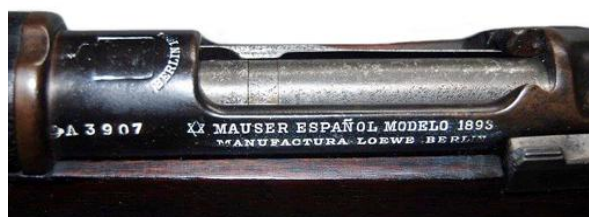
Carabina Mauser Español M.1893 “Nº1”, cal.7 mm, numero A3907 fabricada por Loewe en 1894, y sus marcas.

La carabina numero A463, citada en el párrafo anterior, es un especimen atípico , en que la caña se extiende solo 5,5 cm (2 ½ pulgadas) por delante de la abrazadera. En mi opinión se trata de una modificación irregular, no de un “modelo de fábrica”, atribuible a alguno de sus usuarios o tal vez a la casa Bannerman, de Nueva York, que se sabe alteró muchas de las armas capturadas en la guerra del 98, a fin de ofrecerlas como modelos deportivos. Similares a ésta, sé de la existencia de otras carabinas “reformadas”.