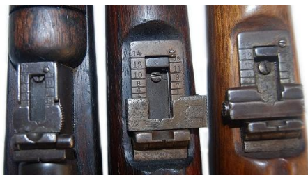
De izquierda a derecha, alza de las carabinas M.91, M.93 (Nº1 y Nº2), y M.95,