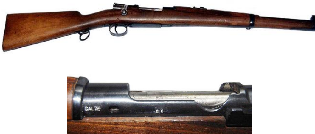
Carabina Mauser M.1895, recompuesta, nº 26 experimental en calibre 7,62 mm NATO.

Dispongo, por último, de una variante experimental , No.26, también recompuesta en la década de 1950, desprovista de marcas y en calibre 7,62 mm NATO .