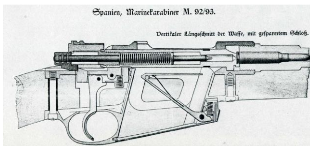
Croquis de la Spanien Marinekarabiner M.92/93 de Marina

La razón por la que, de un contrato de 5.000 carabinas M.92 sólo se construyeron 400 unidades, se explica como consecuencia de contraorden originada por la sustitución de éste modelo por el nuevo fusil M.1893. Estas 400 carabinas, destinadas a su experimentación por parte de la Marina, tendrían concluida su fabricación con anterioridad a la adopción del M.93, por lo que hubieron de ser aceptadas.