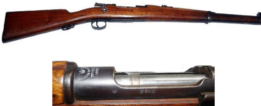
Carabina Mauser M.1895, número 8508 fabricada en Oviedo con fecha 1899.

detalles como el mango del cerrojo, curvo en lugar de angulado. Cuento en mi colección con los ejemplares No. C2110 fechado 1903, el No.8508 fechado 1899, y el No.8479, éste último carente de marca de Oviedo y fecha, recompuesto, con orificio de seguridad, para escape de gases, en el lado izquierdo de la recámara.