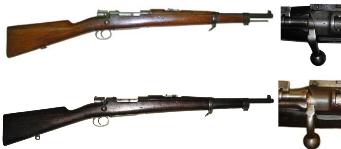
Carabinas Mauser Español 1893 “Nº2”. Arriba, fechada 1894, marcada “Loewe – Berlin”. Abajo, fabricada en Oviedo, sin marcas. Ejemplares en el M.M.M., Barcelona.

Este segundo modelo fue oficialmente denominado “ Carabina Mauser Mod. Nº 2 ”, se diferencia de la anterior, definida “ Nº 1 ”, por no prolongarse la caña hasta el extremo del cañón y contar con tetón de engarce de cuchillo bayoneta, Este modelo Nº 2, que no llegó a ser adoptado reglamentariamente, se produjo en la Fábrica de Oviedo con carácter experimental. Unas 40 unidades del mismo fueron entregadas como dotación de la Compañía de Aerostación , el servicio de globos de observación y dirigibles precursor del futuro Ejército del Aire español. Sí fue adoptado reglamentariamente para carabina, un curioso modelo de machete bayoneta, nominado “ M.1898 para Compañía de Aerostación ”. Barceló, en un artículo publicado en la revista Armas (año XVIII, Nº .206) con el título “ La carabina de Aerostacion ”, ilustra un ejemplar de esta carabina, que difiere del Md. nº2 existente en el M.M.M. en detalles como la forma ergonómica de la plancha del guardamonte, y “una chapita con un orificio circular “ o “mirilla” abatible, situada en el inicio del guardamano, que, en mi opinión, puede constituir una mira para adquisición rápida del blanco (“peep sight” en Inglés).