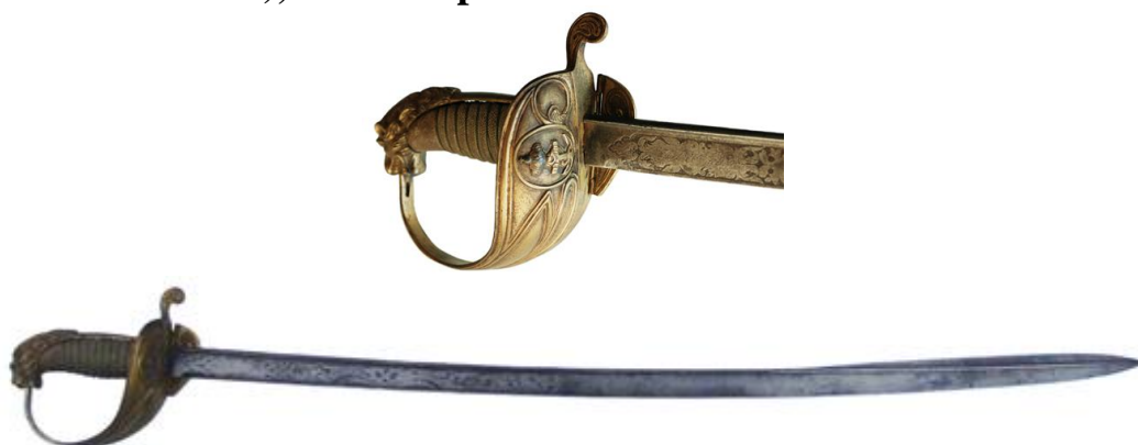
Sable de Oficial del Cuerpo General de la Armada, su vaina de cuero, con juegos de latón. La hoja (762 x 25 mm flecha 13 mm) inscrita “Arta. Fca. de Toledo” / “Año de 1850”. Introducido a inicios de la década de 1840. Mantenido en servicio hasta avanzado el siglo XX, generalizado su uso en la Armada como modelo de Oficial de Marina.