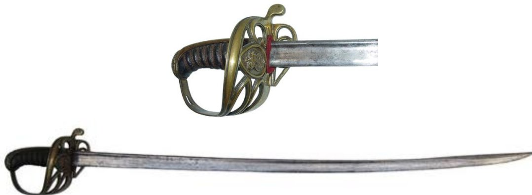
Sable de Oficial de Infantería de Marina, “Md. 1859”, hoja (815 x 29 mm flecha 11 mm), sin inscripción o marca de fábrica

Este modelo lo mantendría en uso el Rl. Cuerpo de Artillería de Marina (1833), el Cuerpo de Artillería e Infantería de Marina (1839) y el Cuerpo Nacional de Artillería de Marina (1841), dividido el año 1848, en las armas de Artillería y de Infantería de Marina, la primera organizada en brigadas hasta 1857, que los artilleros pasaron a integrarse en el Cuerpo de Estado Mayor de Artillería de la Armada, para cuyos oficiales se aprobó el modelo de sable citado en segundo lugar, que en rigor constituye el único a denominar “modelo 1857”. Los oficiales de Infantería de Marina mantendrían el uso del sable que habían compartido con los artilleros.