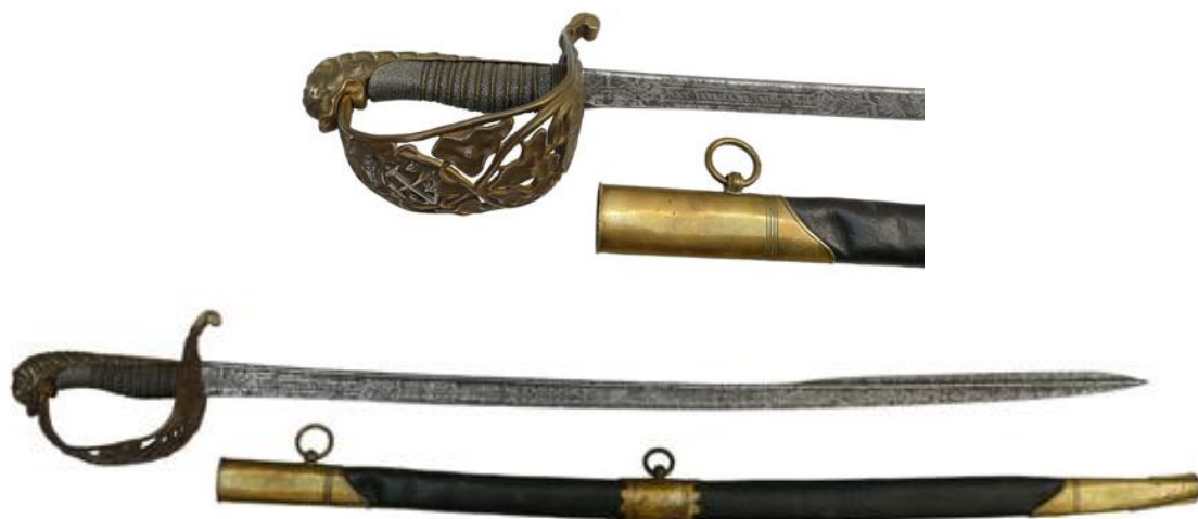
Sable de Oficial del Cuerpo de Estado Mayor de Artillería de la Armada, Md. 1857. Hoja (740 x 26 mm flecha 12 mm) inscrita “ART a FABRICA DE TOLEDO 1858”, mantenido en servicio hasta su sustitución el sable de Oficial de Marina, con anterioridad a 1880