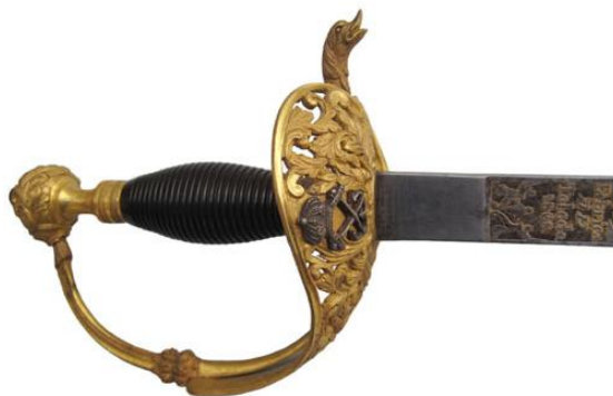
Espada de ceñir de Oficial de Infantería de Marina, Md. 1868. Hoja (815 x 29 mm), labrada e inscrita en anverso “FABRICA / DE / TOLEDO / 1868”

La última de las espadas de ceñir del periodo 1840-74, es el modelo que sustituyó a las primeras, las descritas en el decreto de 30 de mayo de 1840 para generales y brigadieres, que ignoro si mereció una descripción tan detallada como aquellas. Su nominación como “modelo 1870” figura en el texto de una real orden de 19 de mayo de 1887, modificando el Reglamento de uniformidad de 1881. Este modelo de espada de ceñir, con empuñadura de latón dorado para General y plateada para Brigadier, cuenta con guarnición de aro con media cazoleta, labrada con el escudo Nacional.