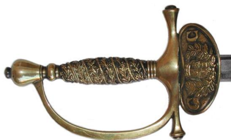
Espada de ceñir de Sargento de la Guardia Civil. En este ejemplar, la hoja (850 x 22 mm) inscrita “ Fca. DE TOLEDO 1868 ”