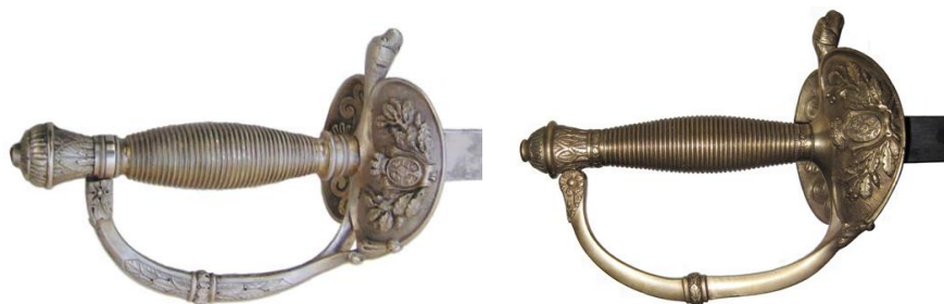
Espadas de ceñir, modelo 1865 de Oficial del Cuerpo de Administración Militar (Izda) y modelo 1867 de Oficial del Arma de Infantería (Dcha)

En el cuerpo de Administración Militar, la abolición del uso del “sable de tirantes”, dispuesta por real orden de 17 de octubre de 1865, justificaría la adopción de un nuevo modelo de espada de ceñir, con empuñadura plateada, guarnición de aro y doble concha alternada, decorada en anverso con el escudo de España. Del mismo tipo, pero con empuñadura dorada, es la espada de ceñir para oficial de Infantería, adoptada por real orden de 30 de enero de 1867, que pondría fin al uso, tanto del “sable de tirantes” como de la espada “isabelina”, por parte de los oficiales del Arma.