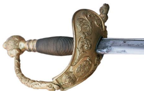
Espada de ceñir de Oficial General, Md. 1870. En este ejemplar, la hoja antigua (771 x 23 mm), del anterior modelo 1840 de Oficial General, inscrita “Fabrica Nl. de Toledo Año de 1845”. Pieza nº 1962-10 en la Colección del M.M.M.

La última de las espadas de ceñir del periodo 1840-74, es el modelo que sustituyó a las primeras, las descritas en el decreto de 30 de mayo de 1840 para generales y brigadieres, que ignoro si mereció una descripción tan detallada como aquellas. Su nominación como “modelo 1870” figura en el texto de una real orden de 19 de mayo de 1887, modificando el Reglamento de uniformidad de 1881. Este modelo de espada de ceñir, con empuñadura de latón dorado para General y plateada para Brigadier, cuenta con guarnición de aro con media cazoleta, labrada con el escudo Nacional.