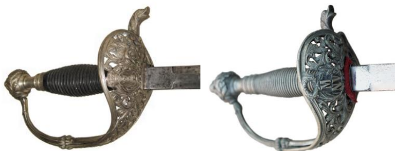
Espadas de ceñir, Md. 1868 de Oficial del Cuerpo de Ingenieros (Izda) y de Oficial de la Milicia Nacional Voluntaria (1874)

De concepción más actualizada, es la espada de ceñir adoptada para los oficiales del cuerpo de Ingenieros, probablemente en 1868, al reformarse su uniforme sustituyendo la casaca por la levita. Las piezas metálicas de su empuñadura plateadas, puño de ébano y guarnición de aro, con media cazoleta calada, incluyendo la torre almenada, atributo del Cuerpo. Del mismo tipo, pero con piezas metálicas en latón dorado, es la espada de ceñir de Oficial de Infantería de Marina, nominada “modelo 1868” en la tarifa de 1871 y “modelo 1860” en el Reglamento de 1886, decorada su cazoleta con las dos anclas cruzadas en aspa que identifican a este Cuerpo.