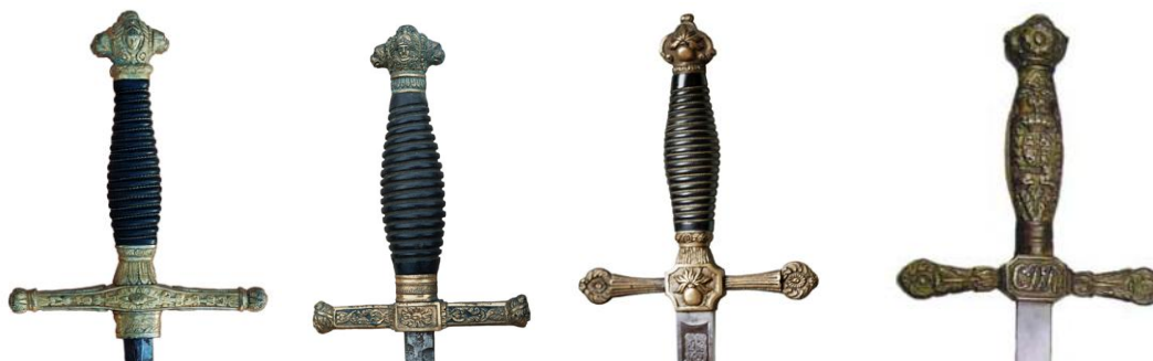
Espadas de ceñir “isabelinas”, de Izda a Dcha, las dos primeras sin referencia a cuerpo o arma, la 3ª del Cuerpo de Artillería, la 4ª de Carabineros del Reino, Md. 1869