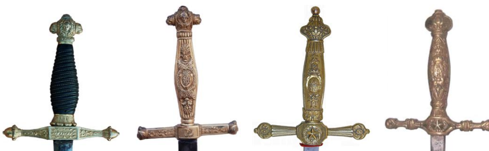
Espadas de ceñir “isabelinas”, del Cuerpo de Estado Mayor. De Izda. a Dcha. las dos primeras, anteriores a 1844, la dos restantes, posteriores a esta fecha