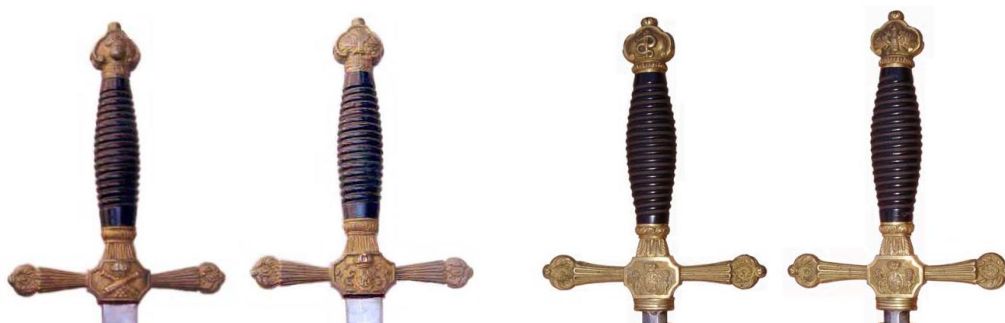
Espadas de ceñir “isabelinas”, de los cuerpos de Artillería (Izda) y Sanidad Militar (Dcha). Anverso y reverso