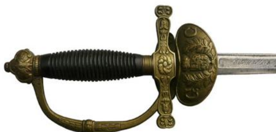
Guardia Civil, espada de ceñir de Oficial de infantería, Md. 1844. Hoja (794 x 22 mm), inscrita en anverso “ Fabrica Nl. de Toledo Año de 1844 ”

En el instituto de Guardia Civil, la adopción en 1844 de un modelo singular de espada de ceñir para sus oficiales de infantería, los excluyó del uso de la espada “isabelina”. Esta espada de ceñir, con piezas metálicas de la empuñadura doradas, puño de ébano y guarnición de aro con doble concha alternada, labrada en anverso con el escudo de España flanqueado por las iniciales G.C., tiene justificada su nominación como modelo 1844. No así, evidentemente, el modelo de espada de ceñir para sargentos de Guardia Civil, con empuñadura totalmente en latón dorado, claramente inspirada en el modelo francés de 1853 de suboficiales de la Gendarmería.