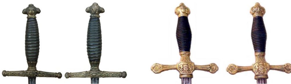
Espadas de ceñir “isabelinas”, en ambas, la “bombeta” en el pomo referencia al Cuerpo de Artillería