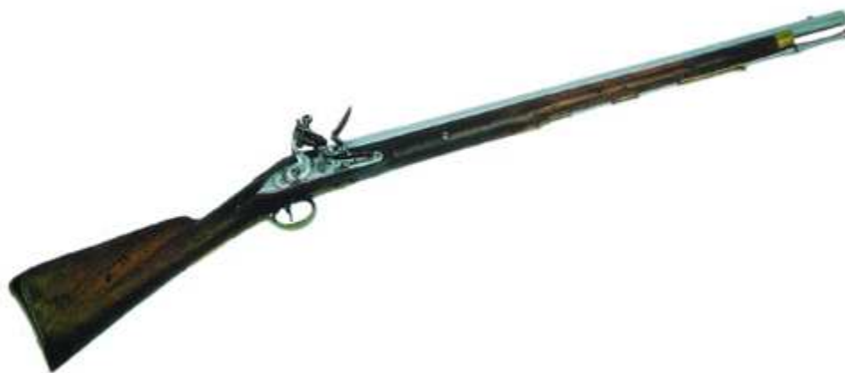
Carabina Elliott, de Dragones. Cañón calibre "de á 23" (16 mm), longitud 713 mm. Pieza Nº 2251 en la Colección del Museo del Ejército.

Detalle característico de este "2º modelo", lo constituye el sistema de retención de la baqueta, tomado de las carabinas Elliott que equipaban a los Dragones británicos durante la Guerra de la Independencia. La baqueta aumenta su diámetro en el lugar oportuno, con una hendidura en la que se introduce la pestaña con que cuenta el casquillo de refuerzo, en la puerta de la caja, para evitar su desplazamiento accidental.