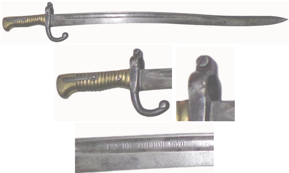
Sable bayoneta asimilado al francés modelo 1866, con hoja 565 x 31 mm, inscrita: Fca. DE TOLEDO 1870. En la guarnición, el ojo de engarce al cañón, diámetro 18 mm, cerrado por tornillo pasador, su cabeza con hendidura longitudinal