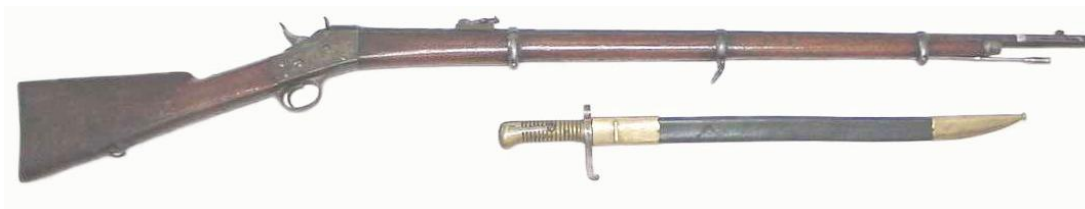
Fusil Remington marcado “La Azpeitiana”, con sable bayoneta carente de marca de constructor

Tampoco descarto la posibilidad de que los sables bayoneta “vascongados” no tuvieran su utilización limitada a fusiles Chassepot. En “La Azpeitiana”, factoría establecida en Azpeitia hacia el año 1870, se produjeron fusiles Remington así como otros con cierre “de tabaquera”, contando con la excéntrica en el cañón destinada al engarce de sable bayoneta. En fusil ilustrado a continuación, su sable bayoneta no puede definirse “réplica” del Chassepot, pero sí “evolución” del mismo en la producción realizada durante la Guerra Carlista 1872-75.