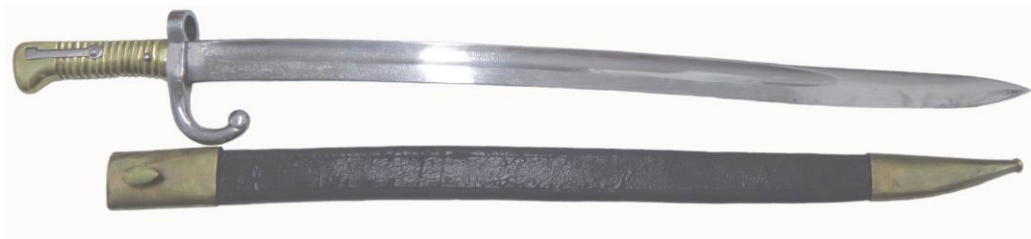
Sable bayoneta Chassepot “vascongado”. La hoja longitud 560 mm, el diámetro interior del ojo de engarce 18 mm, la longitud total 680 mm