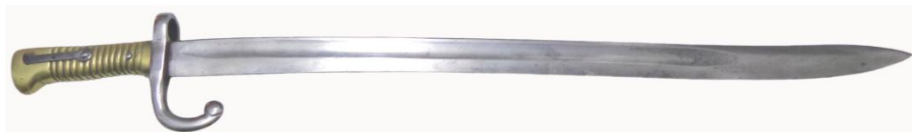
Sable bayoneta Chassepot “vascongado”. La hoja longitud 550 mm, el diámetro interior del ojo de engarce 20 mm, la longitud total 665 mm

Tampoco descarto la posibilidad de que los sables bayoneta “vascongados” no tuvieran su utilización limitada a fusiles Chassepot. En “La Azpeitiana”, factoría establecida en Azpeitia hacia el año 1870, se produjeron fusiles Remington así como otros con cierre “de tabaquera”, contando con la excéntrica en el cañón destinada al engarce de sable bayoneta. En fusil ilustrado a continuación, su sable bayoneta no puede definirse “réplica” del Chassepot, pero sí “evolución” del mismo en la producción realizada durante la Guerra Carlista 1872-75.