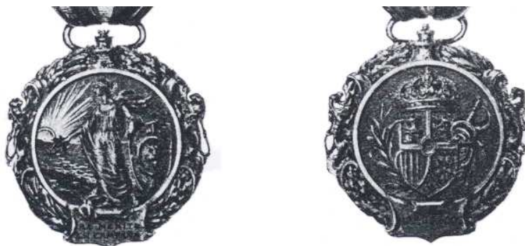
Medalla Militar Individual (7.12.1920)

El escudo con las antiguas Armas Reales figura decorando la guarnición del sable modelo 1878, para Oficial de Caballería, y en las condecoraciones militares instituidas con anterioridad a 1900, como la Orden Militar de María Cristina (30.1.1890) o la Orden Naval de María Cristina (25.2.1891), no así en las instituidas durante el reinado de Alfonso XIII (1902-1931), que de incluir escudo en su diseño, este suele representarse como figura en las monedas acuñadas a partir de 1877.