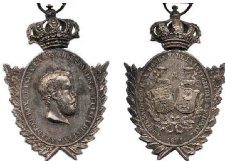
Medalla de los Cuerpos Voluntarios de la Isla de Cuba (1871)

Con la abdicación de Amadeo I, cesó la concesión de la medalla por él instituida (10.11.1871), recompensando méritos en los Cuerpos Voluntarios de la Isla de Cuba, con efigie del monarca y corona real. El Gobierno de la República no proscribió su uso a los que la tenían concedida, sutilmente estableció la necesidad renunciar a ella, para optar a la concesión de la nueva Medalla de la Campaña de Cuba (27.6.1873), argumentando que esta recompensaba servicios a partir de 10 de octubre de 1868 y no cabía obtener una doble recompensa por ellos. Ya expuse que el Gobierno de la Restauración modificó el escudo de esta última medalla, pero sutilmente mantuvo su corona mural, con lo que los condecorados que ya disponían de ella no hubieron de reemplazarla. La Campaña de Cuba se dio por concluida en junio de 1881 disponiéndose entonces el cese en la concesión de esta medalla, y los ejemplares con el diseño de 1873 se demuestran producidos en cantidad muy superior, a los que lo fueron según el diseño modificado en 1875.