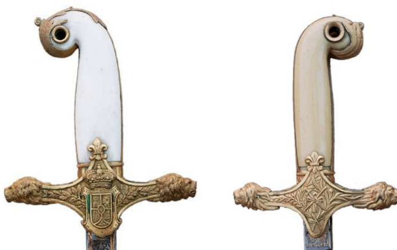
Sable de Oficial General, modelo 1908, del que según O.C. de 27.6.1931 debían desaparecer las flores de lis en los remates y en el escudo, sustituyéndose en este la corona real por la mural (Pieza nº 1962-22 en la Colección del M.M.M.)

Cuantos tengo vistos con estas características, son ejemplares producidos con anterioridad a junio de 1931, en cuyo escudo se han hecho desaparecer las flores de lis y se ha sustituido la corona real por la mural, manteniendo los cuarteles con castillos y leones alternados, aquellos que contaron con este modelo de escudo.