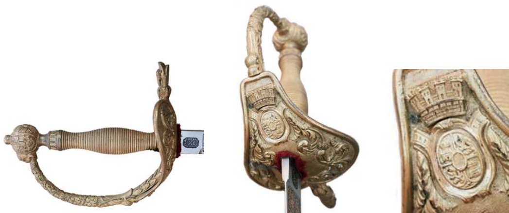
Espada de ceñir Md. 1870, para Oficial General, modificada según O.C. de 27.6.1931 (Pieza nº 1963-1150 en la Colección del M.M.M.)

El único modelo de tropa con el nuevo escudo adoptado por la República, diría fue el de la espada de montar que equipó al Escuadrón de la Guardia del Presidente de la República: la variante de la espada-sable Puerto-Seguro que sustituyó, en el equipo del Escuadrón de la Escolta Real, a la espada de montar aprobada para dicho Escuadrón en R.O. de 29.7.1875.