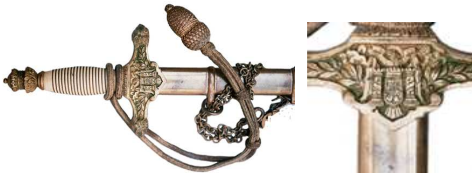
Escudo de España, en modelo reducido, en la guarnición de “machete” para Caballeros Oficiales Cadetes (1940-43)