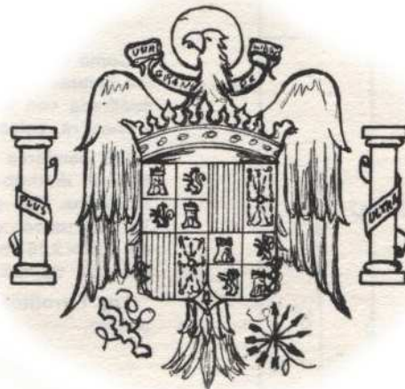
Escudo de España, establecido en Decreto de 2.2.1938

Durante el periodo 1938-1977, el Escudo de España fue el establecido en Decreto de 2 de febrero de 1938, que se afirmaba constituido “con la heráldica de los Reyes Católicos, sustituyendo las armas de Sicilia por las del antiguo reino de Navarra, con lo cual se integran los blasones de las agrupaciones de Estados medievales, que constituyen la España actual” . A los pocos días, por Decreto de 11 de febrero, se publicaron los modelos oficial y reducido, con sólo los cuarteles de Castilla, León, Aragón, Navarra y Granada, sin repeticiones.