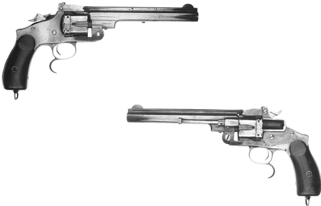
Revolver "Smith", ejemplar inscrito: PRIVILEGIO / IBARRA, con sistema de extracción gaseosa de las vainas "privilegiado" por Luis Ibarra. Variante patentada en 1878 en Norteamérica y en 1881 en España.

Un ejemplar de este modelo figuraba en la Colección del Museo Escuela de Armería de Eibar, según reflejaba el Catálogo editado en 1914, señalándolo producido por "Orbea Hermanos" el año 1880, en número de 25 unidades, calibre 450. En mi opinión, Ibarra contrataría su construcción antes de esta fecha, correspondiendo a esta corta serie los dos que entregó a la J.S.F. para la experimentación sobre la que se informaba en 1877.