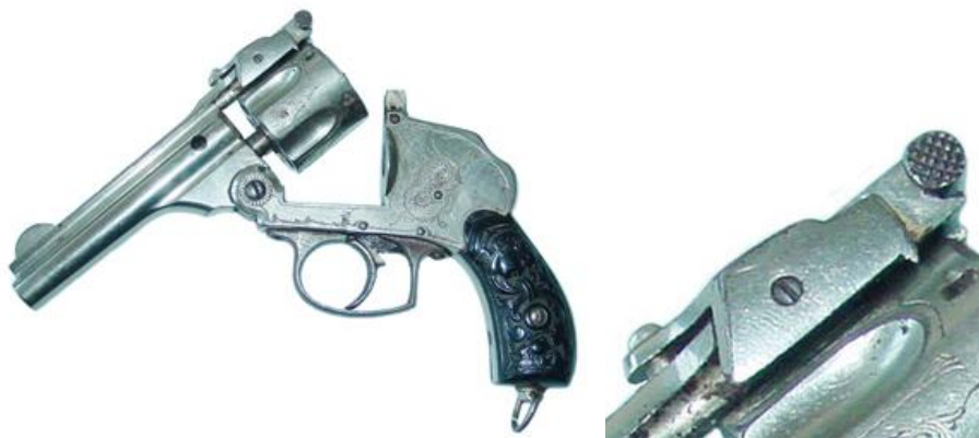
Revolver “Bota-Cilindro”, “Hammerless” de cinco tiros, Cal. 38. Ejemplar con cañón longitud 95 mm (3 ¾”), inscrito: FABRICA DE CRUCELEGUI / EIBAR (ESPAÑA) PRIVILEGIADO

En 1884, con anterioridad a que Luis Crucelegui cotizara por la propiedad de un taller de armas (1887), la “Revista Bascongada” incluía a este fabricante entre los doce que habían expedido más armas en los ocho primeros meses de aquel año, detallando su producción de 577 escopetas de pistón de un cañón, 36 de dos cañones, 196 escopetas Lefauchaux de un cañón, 111 de dos cañones, 103 escopetas Remington, 1.058 pistolas Lefauchaux, 4 pistolas Remington y 743 revólveres. Es evidente que se limitaba a comercializar la producción de distintos talleres. También lo cita Gregorio de Mújica, en su libro “Eibar – Monografía Histórica” (1908), diciendo: “ es uno de los fabricantes que mayor número de armas envía a la Península; fabrica revólveres y escopetas finas ”. Seguía siendo, básicamente, un “Montador”. El revolver BOTA CILINDRO de la “Fábrica de Crucelegui”, lo patentó José Crucelegui pero váyase a saber en realidad, quien lo fabricó.