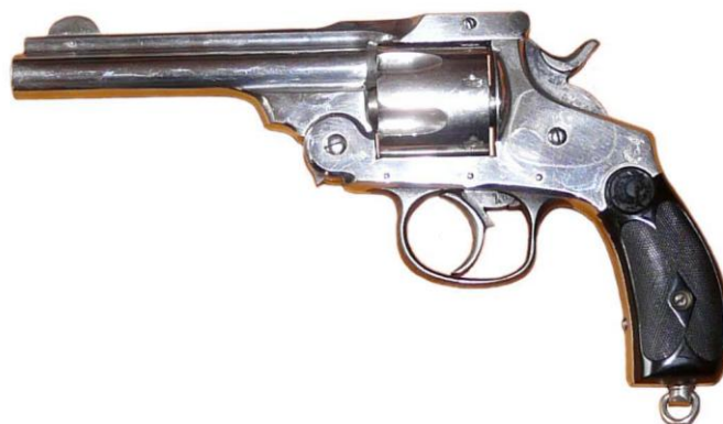
Revolver “Smith Reglamentario”, doble acción, seis tiros, calibre 44. Ejemplar con cañón longitud 129 mm (5”), inscrito: SMITH & WESSON AMERICAN METALLIC CARTRIDGES / ARE TO BE USED FOR OUR MODEL OF REVOLVER, logo “TAC” (Trocaola, Aranzabal y C a . 1899-1926)