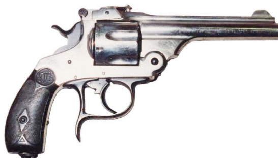
Revolver “Bota Cilindro”, doble acción, cinco tiros, Cal. 38. Ejemplar con cañón longitud 95 mm (3 ¾”), inscrito: FABRICA DE CRUCELEGUI / EIBAR (ESPAÑA) PRIVILEGIADO

Reincidiré en el tema de las ocurrencias habidas en el intento de “mejorar” los revólveres “Smith”, refiriéndome a la patentada en 1890 por José Crucelegui, con el anunciado: “un revólver de doble gatillo, denominado BOTA CILINDRO” . Mera modificación del revolver “Smith”: el segundo “gatillo” es una pieza que, adosada al puente, retiene el cilindro o tambor, liberándolo al ser presionada y permitiendo así su rápida extracción (botándolo). A igual resultado llegó la firma “Larrañaga, Garate y C a ”, mediante otro sistema patentado por ella, según expuse en el artículo dedicado a sus revólveres “Smith”.