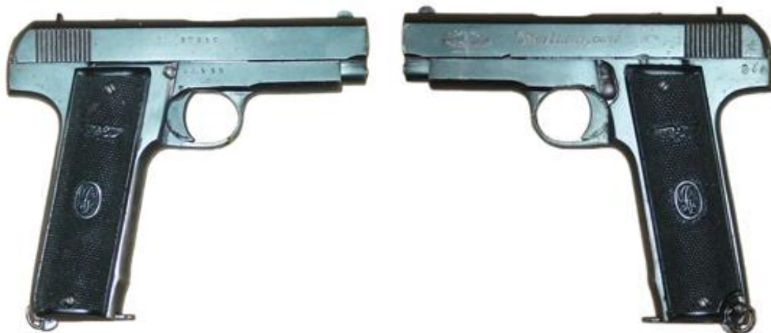
Pistola “PLUS ULTRA”, Cal. 7,65 mm. veintidós tiros, cañón longitud 900 mm marcada “Plus Ultra, Cal. 7,65” logos “PLUS ULTRA” y “GC” (Gabilondo y C a )