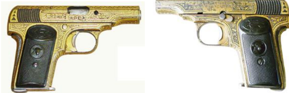
Pistola “BUFALO”, Cal. 7,65 mm, siete tiros, cañón longitud 85 mm, marcada “PISTOLA AUTOMATICA ESPAÑOLA PATS. 62004 Y 67577 / ‘BUFALO’ 7,65 – 32 CAL”, logo “BC” (Beristain y C a )

En España, la fabricación de pistolas basadas en la Browning 1910 pudo iniciarla la firma “Zulaica, Bolumburu y C a ” con las que comercializó con la marca “REX”, registrada en 1914, pero su producción más importante corresponde a la firma “Gabilondo y C a ”, en Elgoibar, sucesora de “Gabilondos y Urresti” y de “Gabilondo, Urresti y C a ”, que al igual que “Esperanza y Unceta” / “Unceta y C a ” en Guernica y Bonifacio Echeverría, en Eibar, mantuvo en alza la calidad de sus productos siendo, de estas firmas, la única que carece de algún trabajo publicado, en que se relate su historia y detalle su producción. Puede deberse a que al igual que durante la Gran Guerra un buen número de industriales armeros trabajaron para ella en la construcción de la pistola “RUBY”, seguidamente fue “Gabilondo y C a ” que estuvo dispuesta a trabajar para otros.