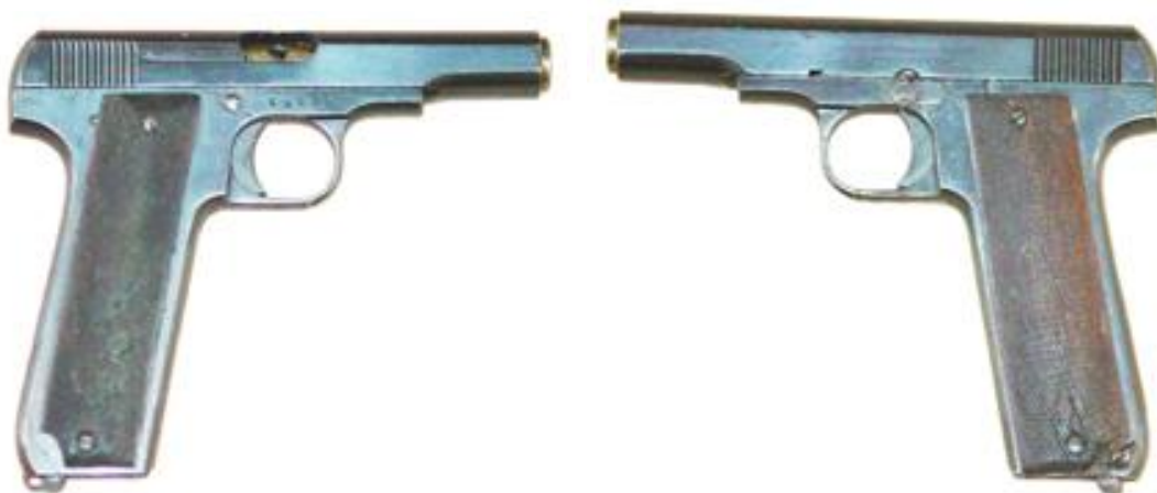
Pistola “DANTON”, Cal. 7,65 mm. doce tiros, cañón longitud 100 mm marcada “AUTOMATIC PISTOL WAR MODEL CAL 7,65 (32) / ‘DANTON’ PATENT 70724 – TESTED”, logo “GC” (Gabilondo y C a ) .

Sería en razón a que la fortuna habida con la pistola “RUBY” durante la Gran Guerra se debía a la idea de aumentar a nueve cartuchos la capacidad de sus cargadores, que en los años 1920’s se presentaron modelos con aún mayor capacidad de carga. “Gabilondo y C a ” produjo las “DANTON” en variantes para doce cartuchos. “Unceta y C a ” fabricó su “ASTRA 100 SPECIAL”, del “tipo Eibar”, para igual número de cartuchos y lo mismo hizo “Beistegui Hermanos” con sus “ROYAL”, todas ellas con empuñaduras desproporcionadas. “Gabilondo y C a ” rizó el rizo, con las marcas “RUBY EXTRA” y “PLUS ULTRA”, registrada en 1928, comercializó una pistola “tipo Eibar”, de 22 tiros. Este modelo, que se afirma adoptado por la Fuerza Aérea japonesa, era asimismo ofertado con la marca “TRUST” por la firma comercial “El Trust Eibarrés S.L.”.