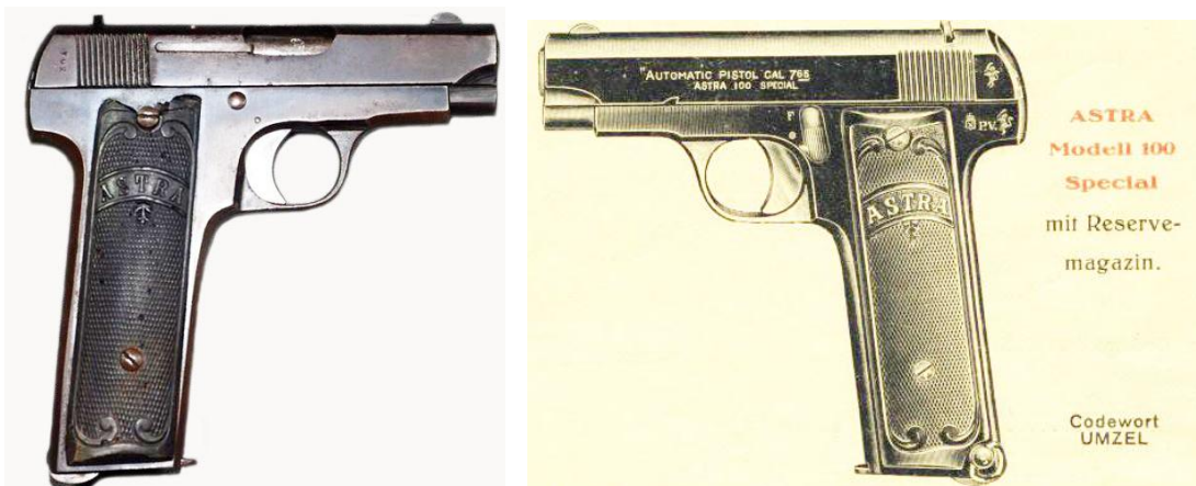
Pistola “ASTRA 100 SPECIAL”, Cal. 7,65 mm doce tiros, con su folleto propagandístico, de la firma “Unceta y C a ”