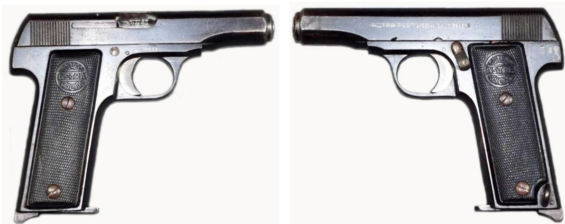
Pistola ASTRA 700 SPECIAL Cal. 7,65 mm. marcada “ASTRA 700 SPECIAL Cal. 7,65 (32)” logo “ASTRA UC” (Unceta y c a )