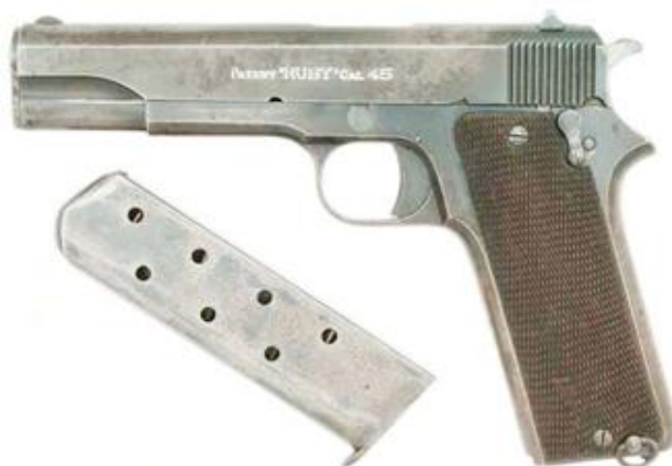
Pistola basada en la Colt 1911, producida por “Gabilondo y Comp a ” con la marca “PATENT ‘RUBY’ CAL. 45”. En su catálogo Nº 25 se ofertaba también en calibre 9 mm.