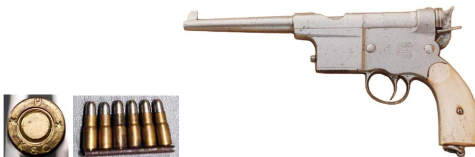
Pistola “Charola y Anitua”, 1ª serie. Sus cachas no son las originales

En el inicial Catálogo del Museo Escuela de Armería de Eibar, editado en 1914, las pistolas “Charola y Anitua” se dicen fabricadas en Eibar, desde el año 1897 hasta el de 1905, en un total de 8.400 unidades. Steven B. Fox 1 no cree fueran tantas, considerando que en calibre 5 mm se produjeron unas 3.000 y en calibre 7 mm lo fueron 2.000, las primeras con variantes de detalle que permiten establecer cuatro series, las segundas en dos modelos, uno con depósito de carga fijo y el otro utilizando cargadores.