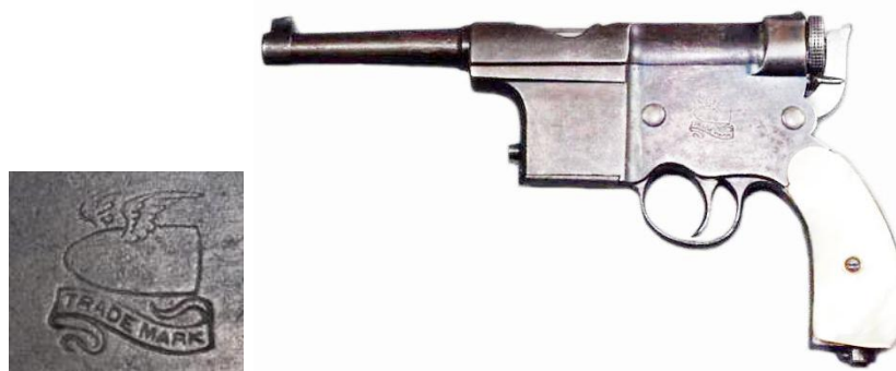
Pistola “Charola y Anitua” calibre 7 mm con depósito de carga

Como la mayoría de las eibarreas de la época, las pistolas “Charola y Anitua” no fueron construidas por entero en el taller de la calle Estación, se afirma que la fábrica de “Garate, Anitua y C a .” tuvo papel importante en su manufactura, así como que su venta conoció en Rusia un éxito superior al alcanzado en otros países.