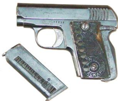
Pistola "tipo Eibar", Cal. 6,35 mm Siete tiros, con seguro de empuñadura y visores para conocer el número de cartuchos que contiene el cargador. Ejemplar con marca "ALKAR" e inscripción: "AUTOMATIC PISTOL MODEL NEW ALKAR". En las cachas: "CAL 6,35" y "NUEVA ALKAR". También fue comercializada con la reseña "MANUFACTURA DE ARMAS DE FUEGO - GUERNICA", sucesora de la "S.A. ALKAR", desaparecida en 1922 a causa de un incendio que destruyó su fábrica

Con la Gran Guerra, la industria armera eibarresa obtuvo cierta mejora en la consideración que merecían sus productos en el mercado internacional, donde hasta entonces no habían superado, en el mejor de los casos, el calificativo de "copias baratas" que por carecer, ni contaban con la garantía de haber sido sometidas a prueba en un Banco "oficial".