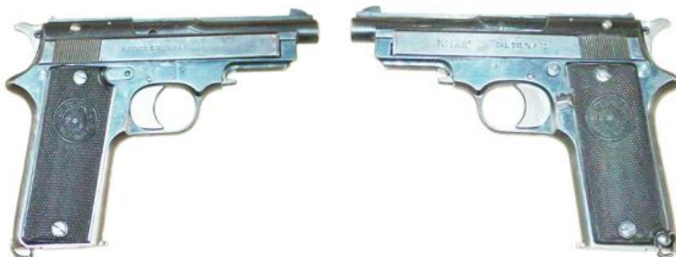
Pistola STAR, Md. 1926, Cal. 7,65 mm. Ocho tiros, cañón longitud 95 mm inscrita: "BONIFACIO ECHEVERRIA EIBAR (ESPAÑA)" y "STAR CAL 7,65 m/m & 32"