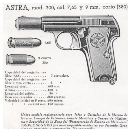
Pistola "ASTRA 300" Cal. 9 mm Corto, marcada "UNCETA Y COMPAÑÍA S.A. GUERNICA ESPAÑA" logo "ASTRA U.C.", con folleto propagandístico

Las pistolas ASTRA 400 y ASTRA 300, inspiradas en la Campo-Giro, reunían detalles patentados por Pedro Careaga Garagarza y por Juan Esperanza Salvador, al primero ya me referí al tratar de las "Browning" eibarresas, el segundo estuvo asociado con Pedro Unceta en la firma "Esperanza y Unceta" hasta el año 1925, que salió de ella para establecerse con la razón social "Esperanza y C a ", en Guernica primero y en Marquina. "Esperanza y