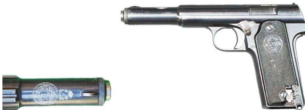
Pistola de 9 mm. Md. 1921, de Marina, ocho tiros, Cal. 9 mm "largo", cañón longitud 150 mm. número 17.671, marcada: "ESPERANZA Y UNCETA / GUERNICA ESPAÑA / PISTOLA DE 9 mm / MODELO 1921", logo "ASTRA E.U." (Esperanza y Unceta 1921-26).

Tras ser adoptada por el Ejército, la pistola "Md. 1921" lo fue en 1922 por el Cuerpo de Carabineros así como por el de Prisiones, en 1923 lo fue por la Armada, en 1930 por el Cuerpo de Vigilancia y Seguridad de la Zona de Protectorado de España en Marruecos y en 1931 por la Aviación Militar. La Armada optó por una variante del Md. 1921 que disponía del sistema de sujeción del cargador, similar al de la ASTRA 300. "Unceta y C a " acreditaba la ASTRA 300 como " Único modelo reglamentario para Jefes y Oficiales de la Marina de Guerra... ", lo que no he tenido oportunidad de constatar. Según me aseguró un artillero muy relacionado con esta firma, fue el redactado de la R.O. de adopción del Md. 1921, que indicaba "Calibre 9 mm.", sin precisar el tipo de cartucho, lo que hizo posible que en la Armada y otros cuerpos, los Jefes y Oficiales optaran por equiparse "reglamentariamente" con la "ASTRA 300", de proporciones más reducidas y porte más cómodo.