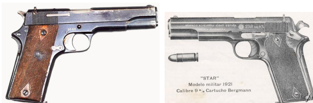
Pistola STAR MODELO MILITAR 1921