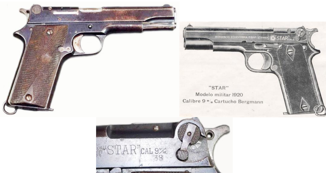
Pistola “STAR MODELO MILITAR 1920”

Unceta”, dirigida a la sazón por Rufino Unceta, se reestructuró como “Unceta y C a ”, manteniendo la propiedad de la marca “ASTRA”, así como la producción de los modelos 400 y 300 hasta los años 1945 y 1947, respectivamente.