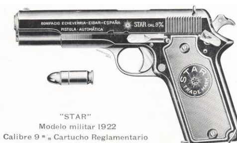
Pistola “STAR MODELO MILITAR 1922”