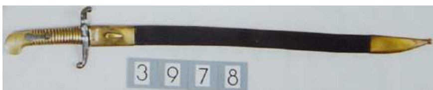
Sable-bayoneta Md. 1858 para Infantería de Marina, en la Colección del Museo del Ejército

En sus trabajos, Barceló se refirió a los dos modelos: el de 1858 “para Infantería de Marina” utilizado por la carabina Md. 1857 en su variante para Infantería de Marina, y el de 1864 “para la Marina”, sin informar del modelo de arma que lo montaba. En su primer trabajo (1976) únicamente incluía fotografías del que decía corresponder al Md. 1858. En el publicado en 2002, el Md. 1858 (I.3.14.a y b) lo ilustró con fotografías del que creo es el ejemplar del Museo del Ejército (nº 3978), y el Md 1864 (I.3.19.a y b), con las fotografías con que en su anterior trabajo ilustraba el Md. 1858 (¿?).