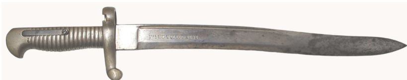
Cuchillo-bayoneta, hoja de doble curvatura (332 x 30 mm) inscrita: Fca. DE TOLEDO 1871, empuñadura de latón, plateada, diámetro Int. del ojo 16 mm.

No cabe discusión en el hecho de que en fecha 11 de enero de 1864 se aprobó un sable-bayoneta de Marina, nominado Md. 1864, del que como mínimo se conserva su “plantilla”, pero ¿Conoció de más producción que la de su muestra? Diría que no, lo que pudo deberse a que se trató de un modelo de sable-bayoneta aprobado con anterioridad a que lo fuera el arma que debería montarlo, que nunca llegó a definirse.