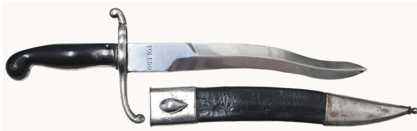
Cuchillo-bayoneta, hoja de doble curvatura (250 x 30 mm) inscrita: TOLEDO / 1867.