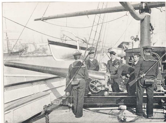
EJERCICIO DE CAÑÓN A BORDO DE UN CAÑONERO.—Se procede á la carga de un cañón Honoria, de 12 centímetros y de cinco millas de alcance, cuyos cañones han dado soberbios resultados, siendo su inventor un distinguido oficial del ejército español.

El modelo de carabina de Marina del año 1847 pudo ser el último “de Marina”, los que le sucedieron como equipo de marinería serían modelos del Ejército. Las “fototipias” de la obra “El Ejército Español y la Armada” (1895), muestran a los marinos equipados, en los servicios de armas, con fusiles Remington Md. 1871 o 1871-89,